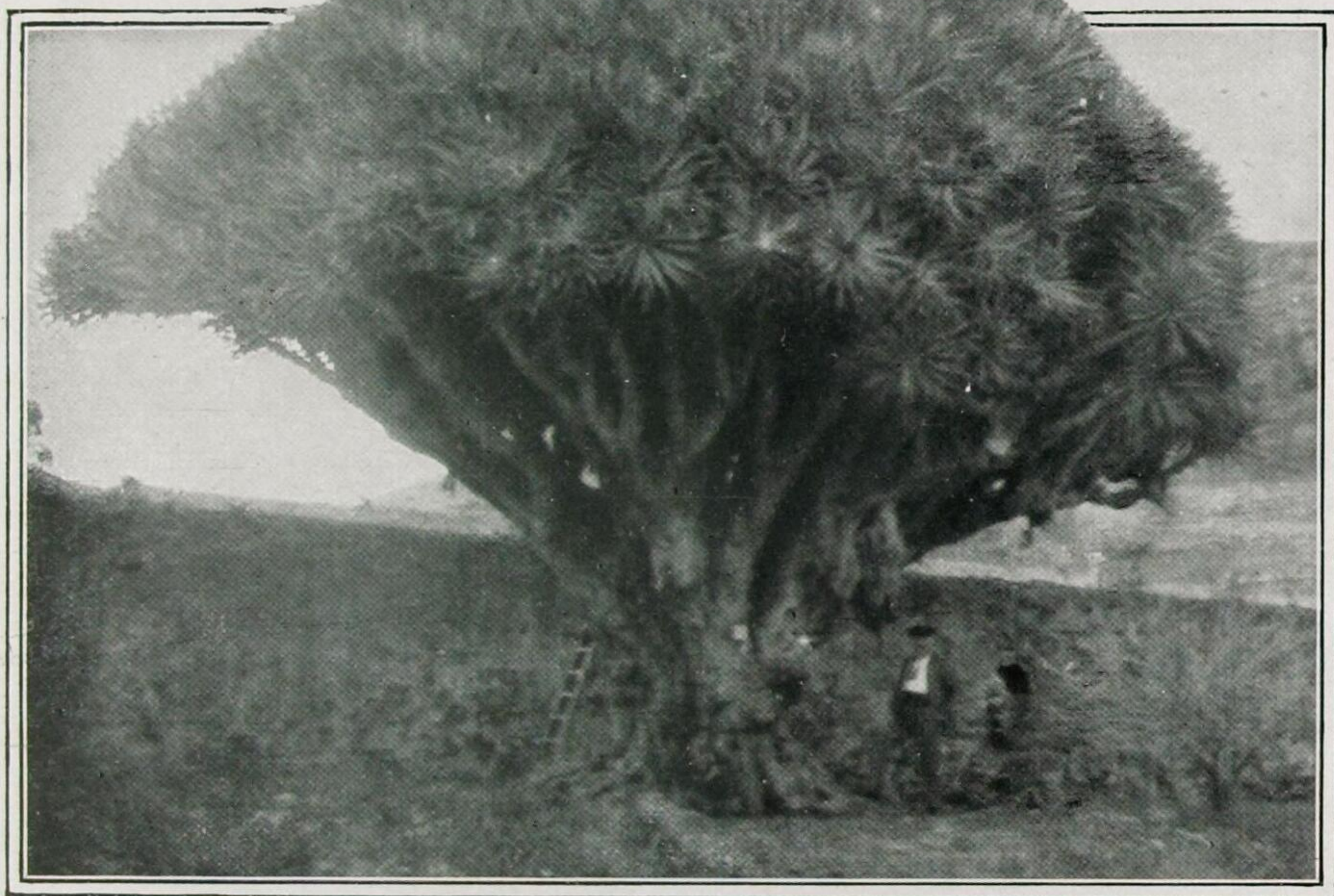
3000 Jahre alter Drachenbaum auf den Kanarischen Inseln