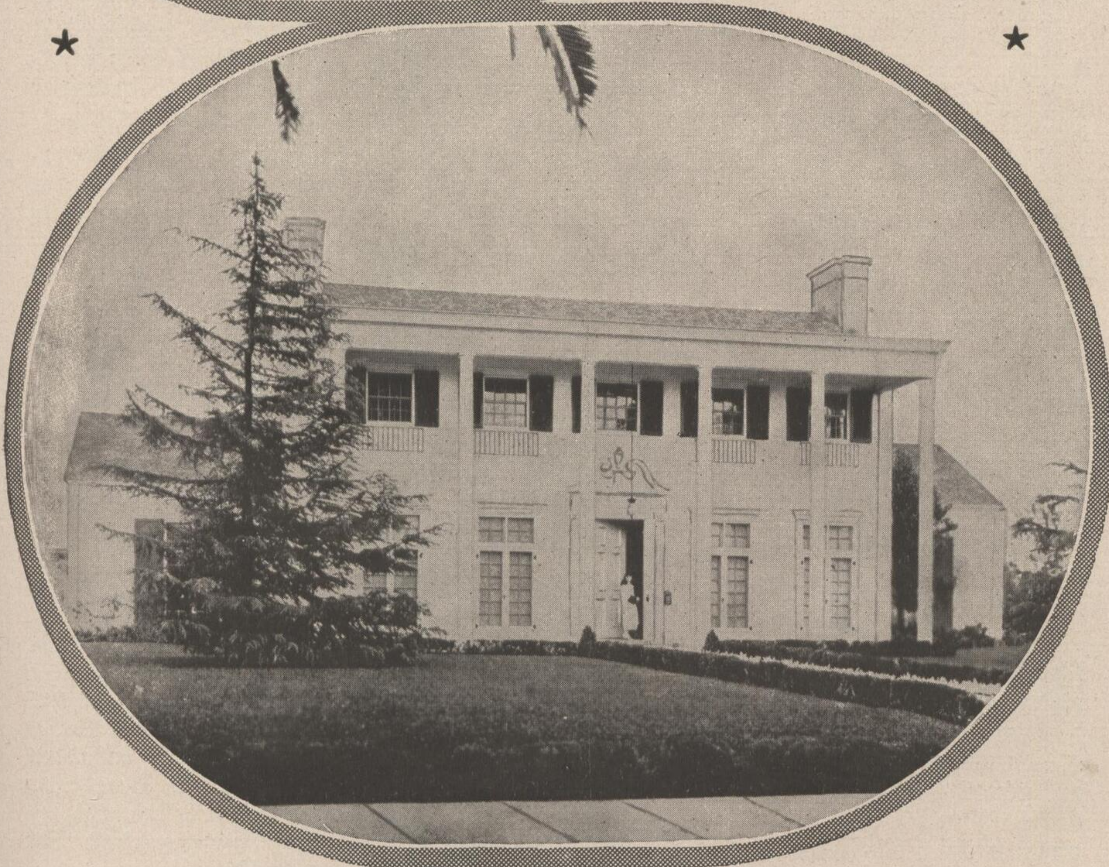
Pola Negri's Heim in Bevery Hill bei Hollywood.