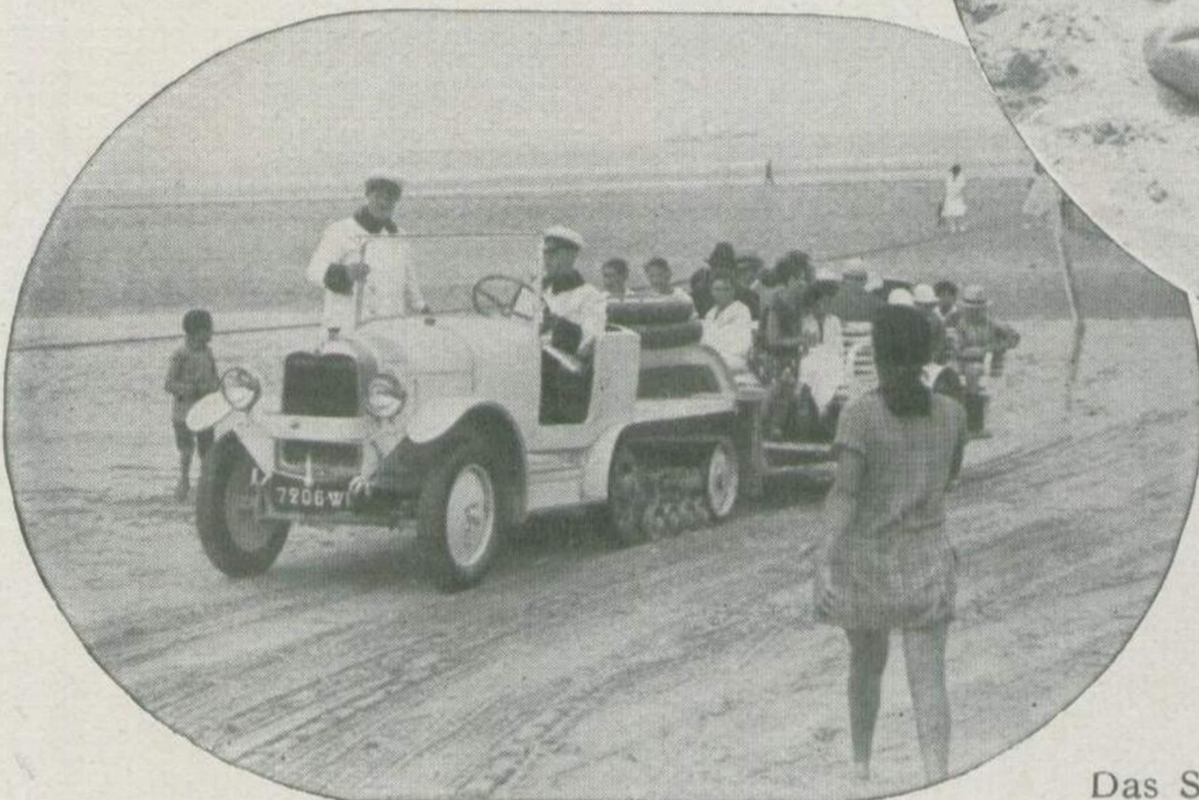
Das Strand-Auto der Badegäste

Welt nicht ihresgleichen und doch fehlt ihnen etwas: das große internationale Publikum, das sich in Deauville, Biarritz,