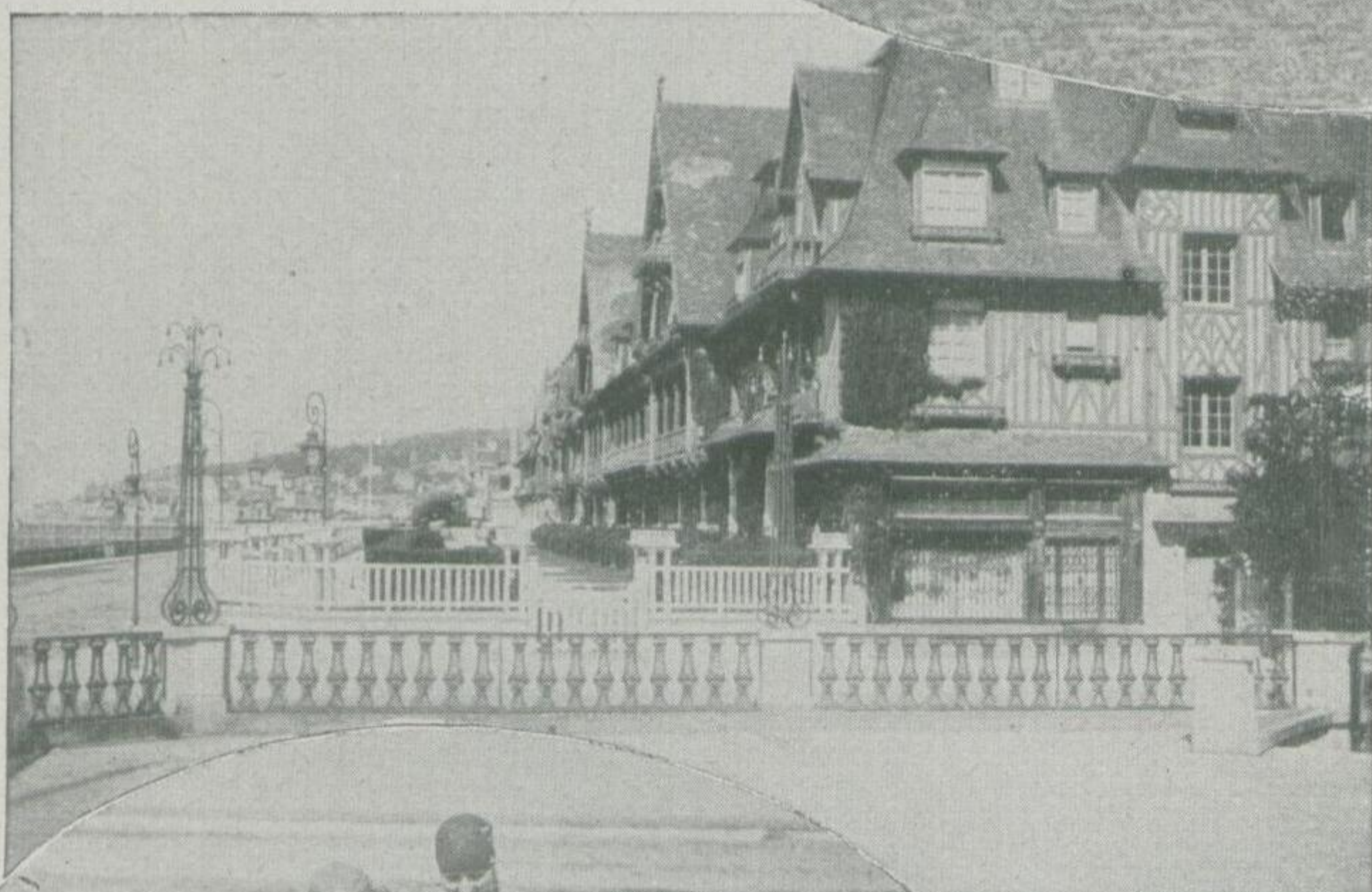
Das im Stil eines englischen Landhauses erbaute Normandy-Hotel