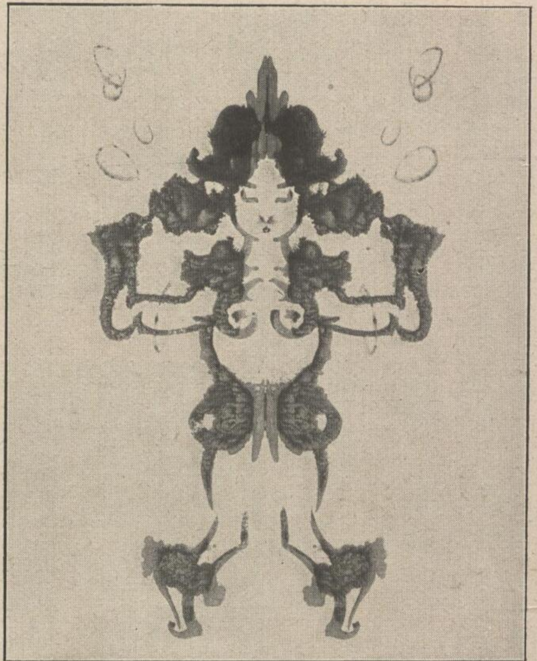
Charleston auf den Azoren