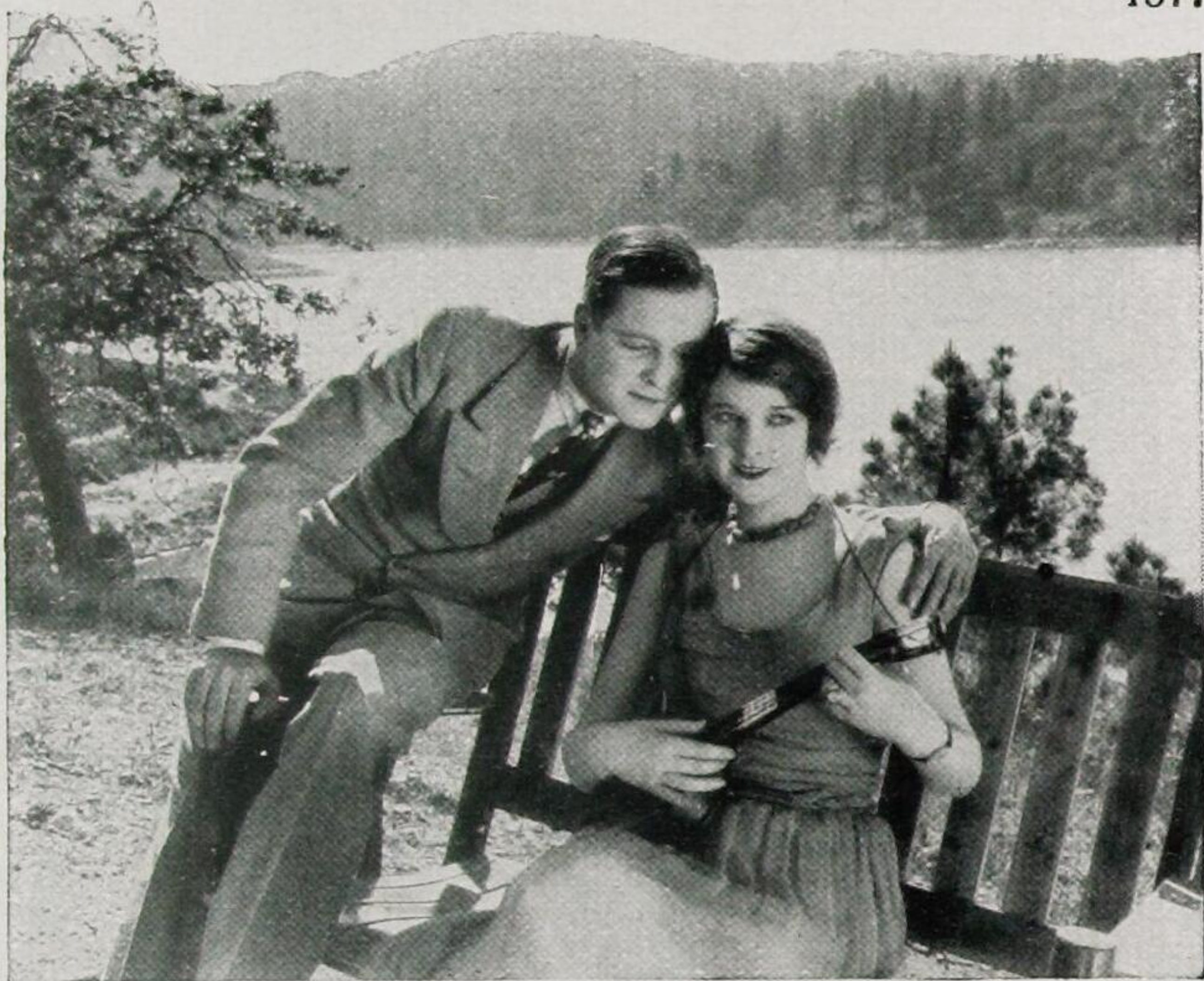
Eleanor Boardman und Creighton Hale machen täglich Weekend

Die frische Luft wirkt allmählich ermüdend und Creigh-