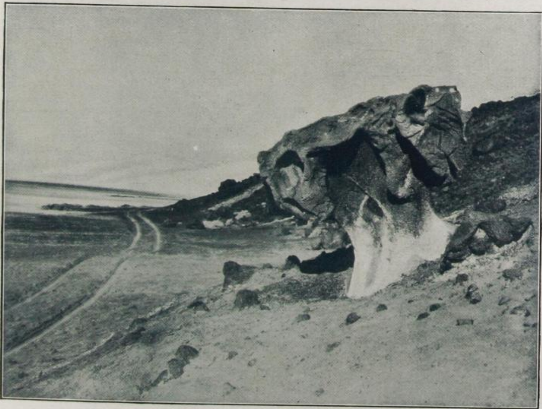
Kalifornien: Der „Schlangenkopf“, Eingang zum „Todestal“ in Süd-Kalifornien