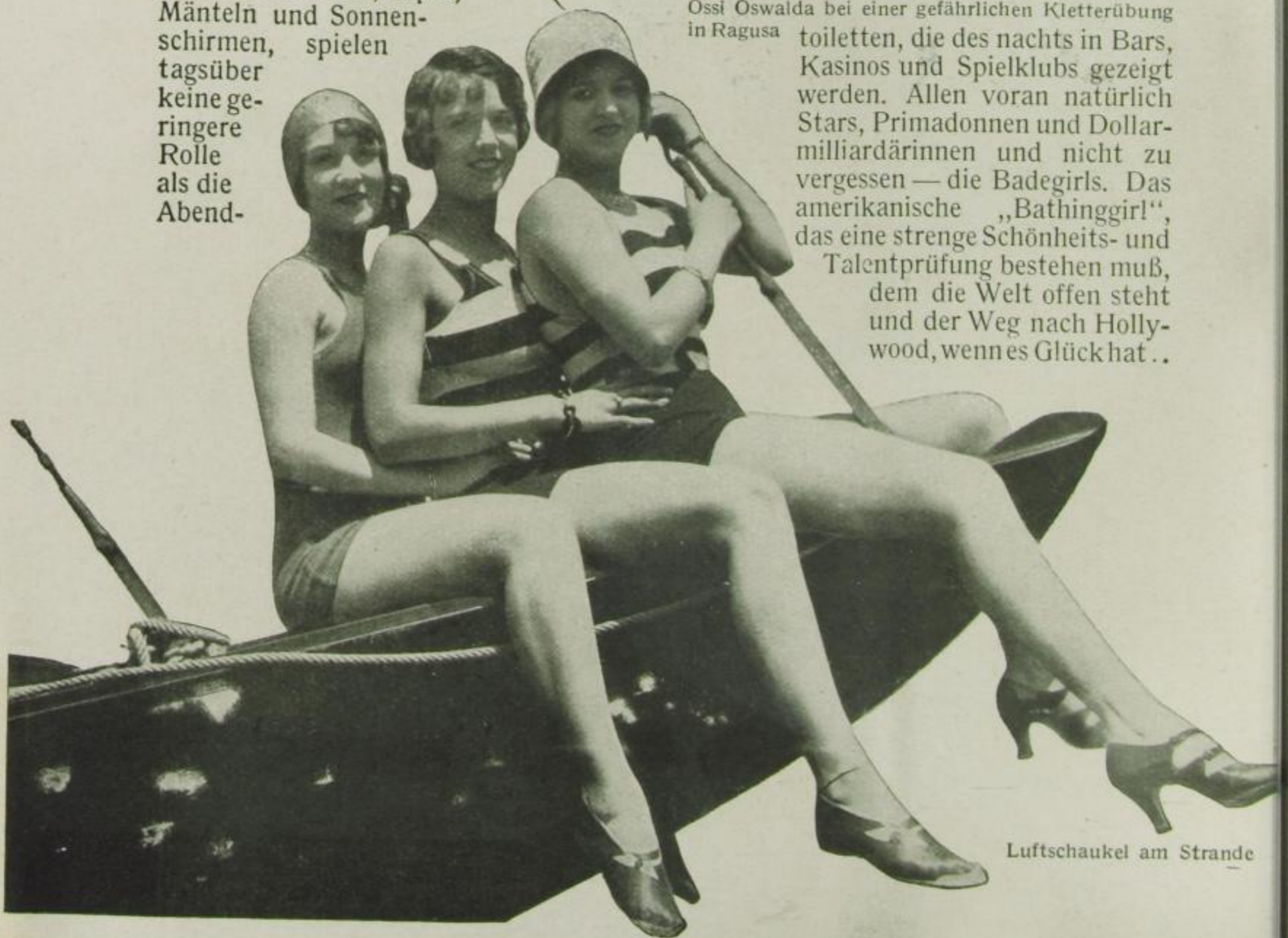
Luftschaukel am Strande

toiletten, die des nachts in Bars, Kasinos und Spielklubs gezeigt werden. Allen voran natürlich Stars, Primadonnen und Dollar-millionärinnen und nicht zu vergessen — die Badegirls. Das amerikanische „Bathinggirl“, das eine strenge Schönheits- und Talentprüfung bestehen muß, dem die Welt offen steht und der Weg nach Hollywood, wenn es Glück hat..