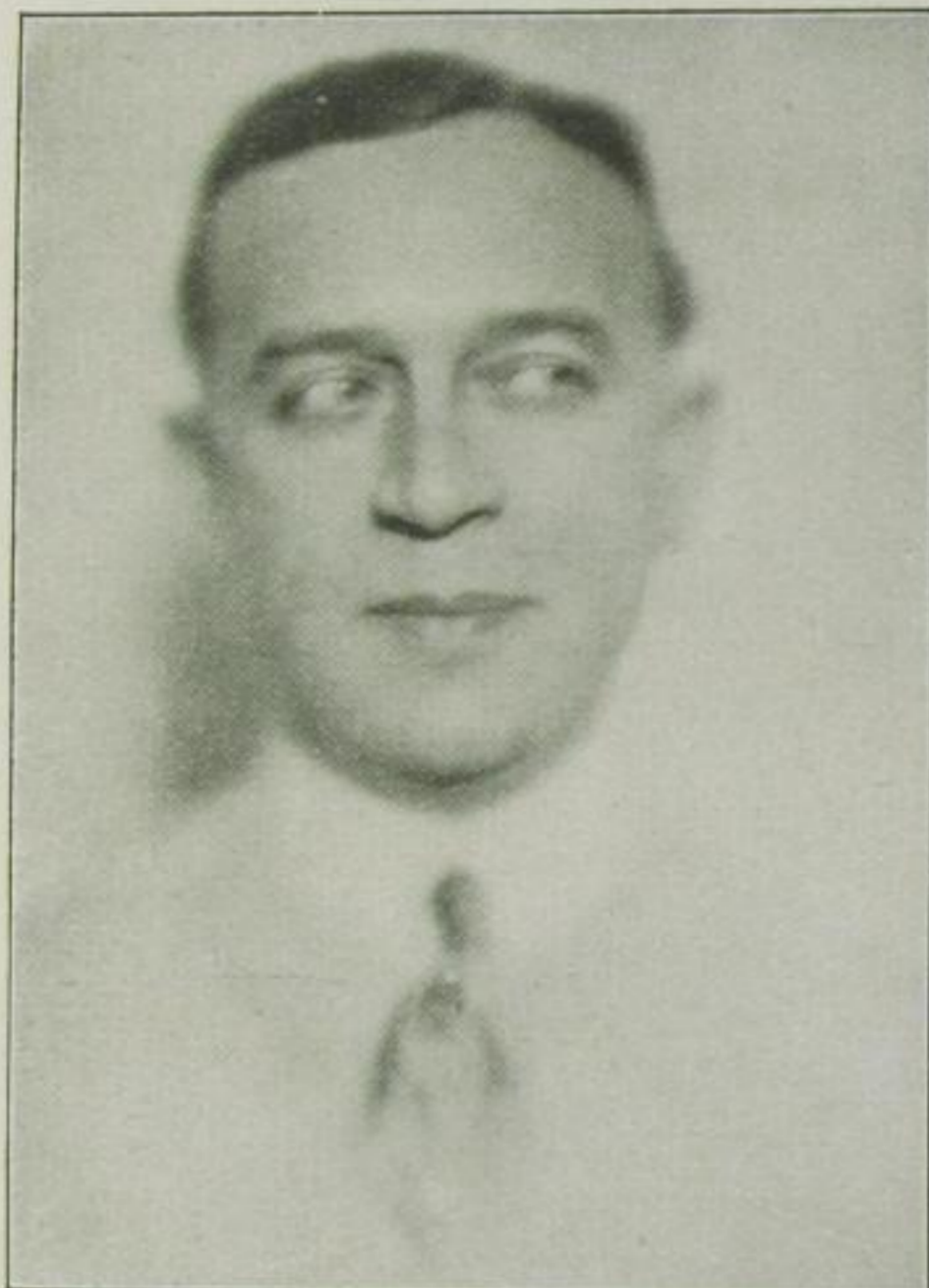
Dr. Max Alsberg