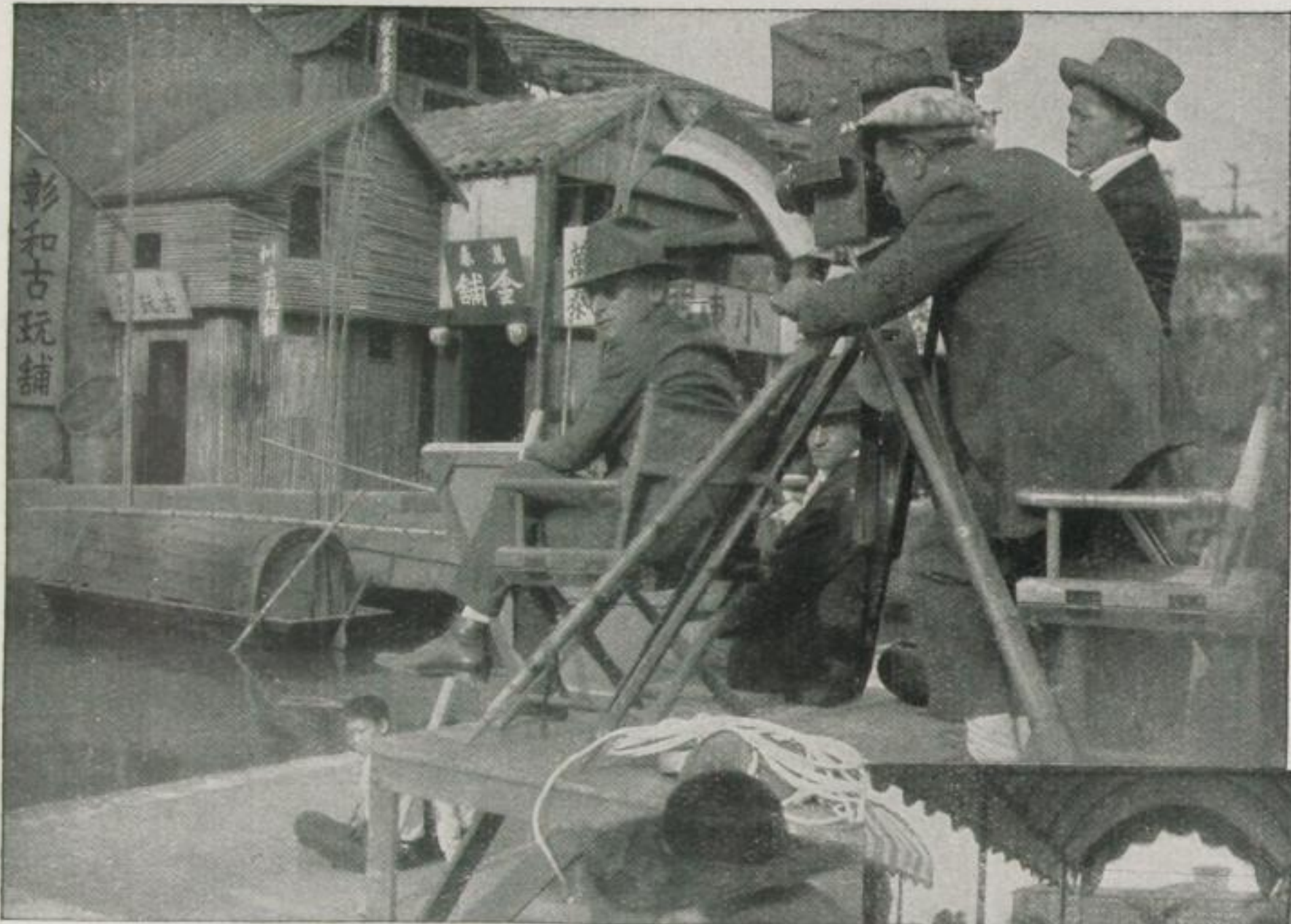
Es wird gedreht: China ist aufgebaut