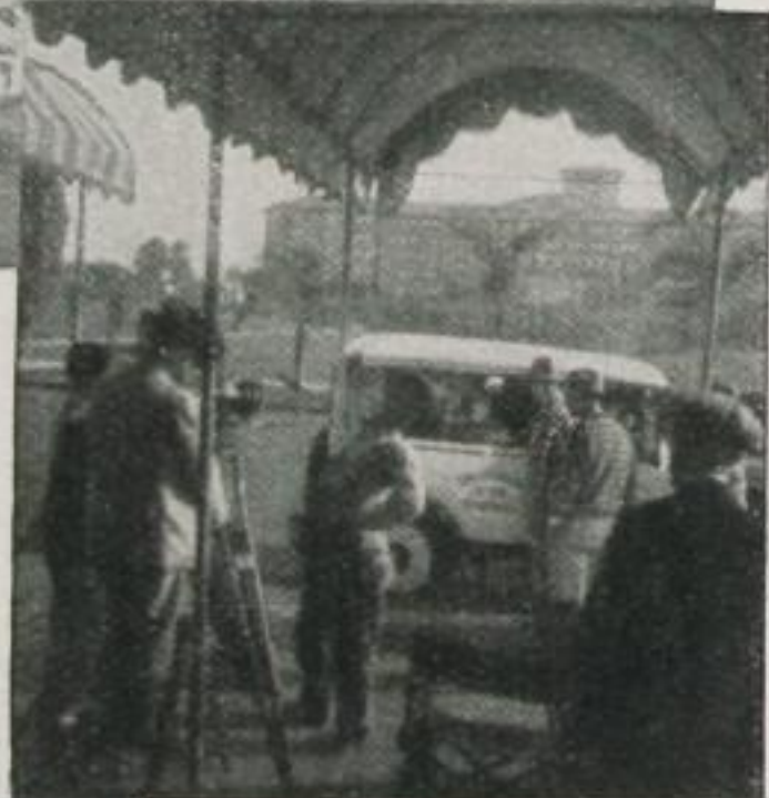
Constance Talmadge filmt

trifft sich selten in Restaurants. Wozu? May fair Club, the Gabels Club, die großen Hotels und vor allem die meist reizenden Heime der Filmwelt sind die Orte, wo sich das Kolonialleben abspielt. Die Cocktails und die guten Weine, die der gastliche Film-poet Hans Kraly seinen Freunden vorsetzt, sind