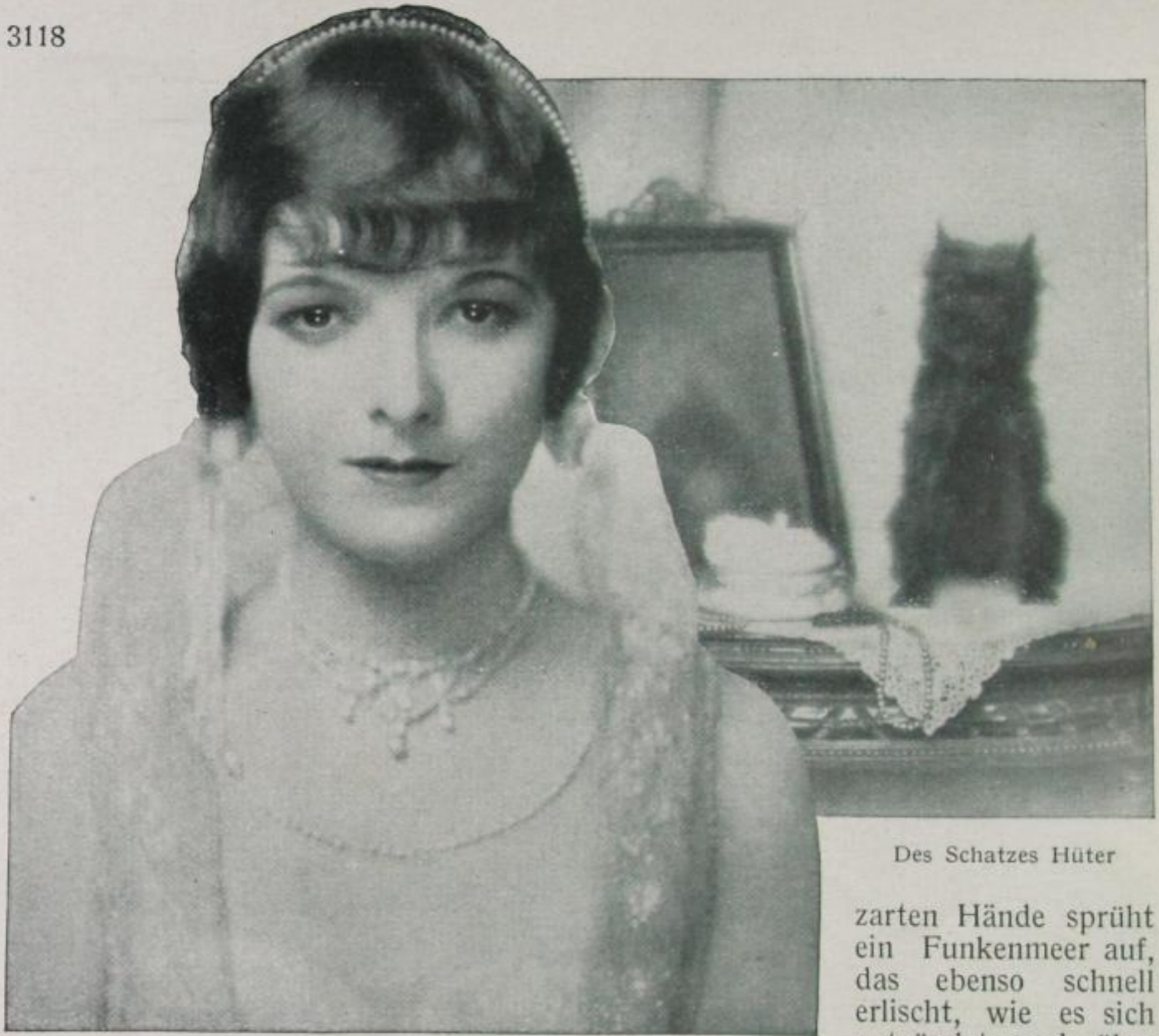
Des Schatzes Hüter

zarten Hände sprüht ein Funkenmeer auf, das ebenso schnell erlischt, wie es sich entzündet und über