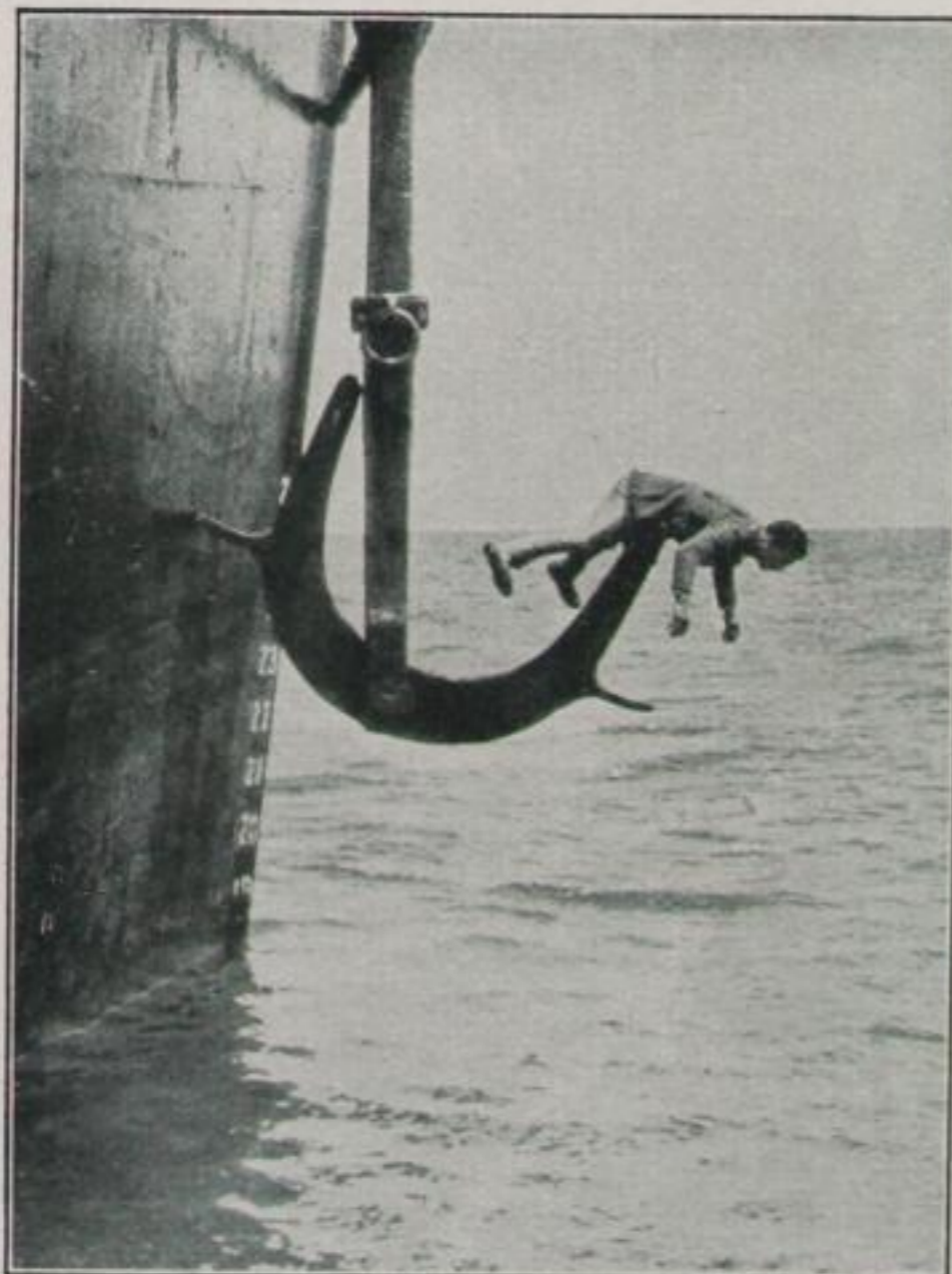
Spiel mit den Nerven

Freude, die Natur mit eigener Körperkraft zu bezwingen, zu immer neuem Wagemut an. Der Milliardärssohn tanzt mit der Dollarprinzessin Charleston auf einem schwankenden Brett über einem Wolkenkratzer — man muß doch endlich einmal auf der Höhe des Lebens sein! Der Filmoperateur wird zum Akrobaten, um Fallschirmspringer aus der Vogelperspektive vom Ballon aus aufnehmen zu können. Der Wissenschaftler sperrt sich jahrelang mit Typhus-, Diphtherie- und Malaria-Bakterien ein. Einer, den die Welt für verrückt hält, setzt sich auf den elektrischen Stuhl, um ein Experiment auszuführen. Alles Menschen, die mit dem Leben spielen . . . . .