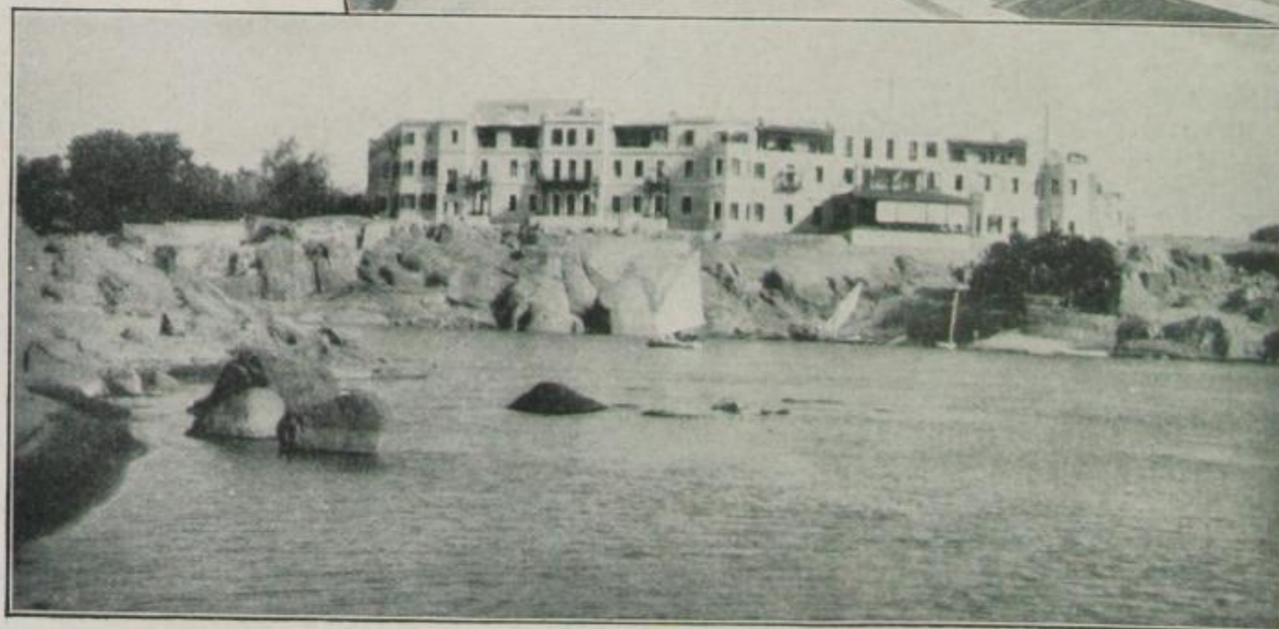
Cataracthotel in Assuan