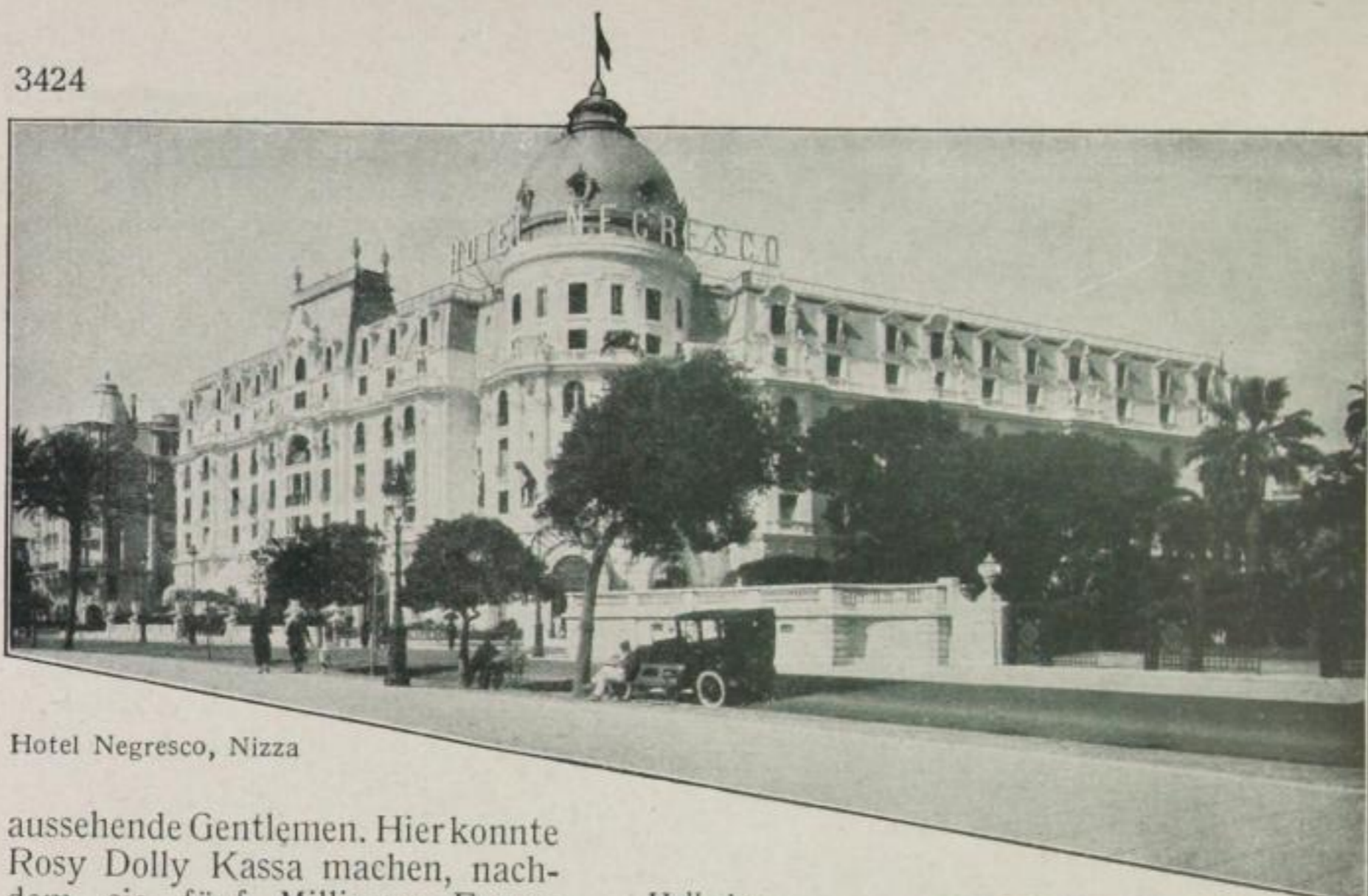
Hotel Negresco, Nizza

aussehende Gentlemen. Hier konnte Rosy Dolly Kassa machen, nachdem sie fünf Millionen Francs gewonnen hatte.