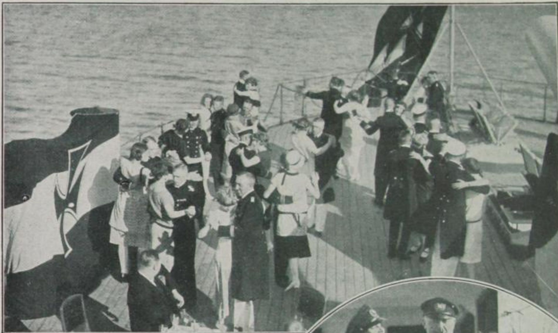
Ball an Bord eines deutschen Kriegsschiffes lichem Runkeln die schlanksten Beine erst in die wirkungsvollste Beleuch- tung rückt. Ein Taucher wird aufge-