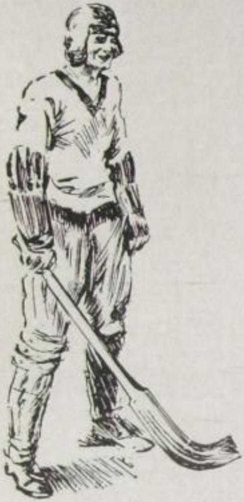
Dem Sportsmann — Siegestrophen