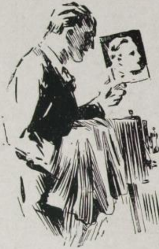
Dem Backfisch — Das Bild des „Schwarmes aller Mädchenträume“