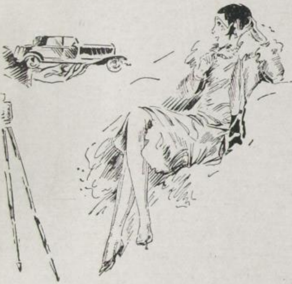
Der Mondainen — die Limousine