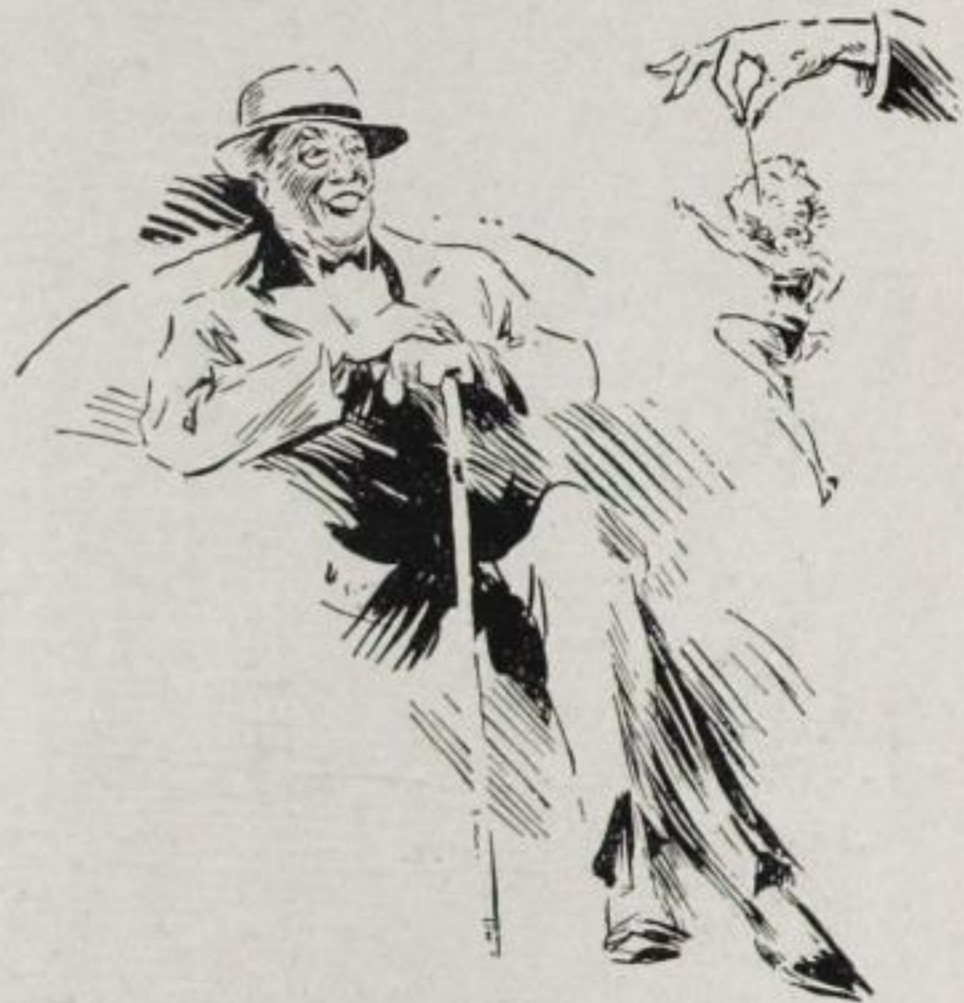
Dem Lebemann — die Ballerine