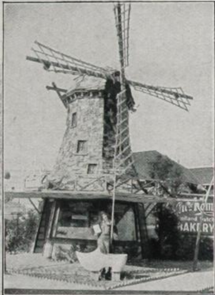
Eine nicht minder originelle wie gute holländische Bäckerei in Hollywood

Besondere Anziehung übt das Eulenhaus, das in einer Straße von Los Angeles steht, auf Kinder aus