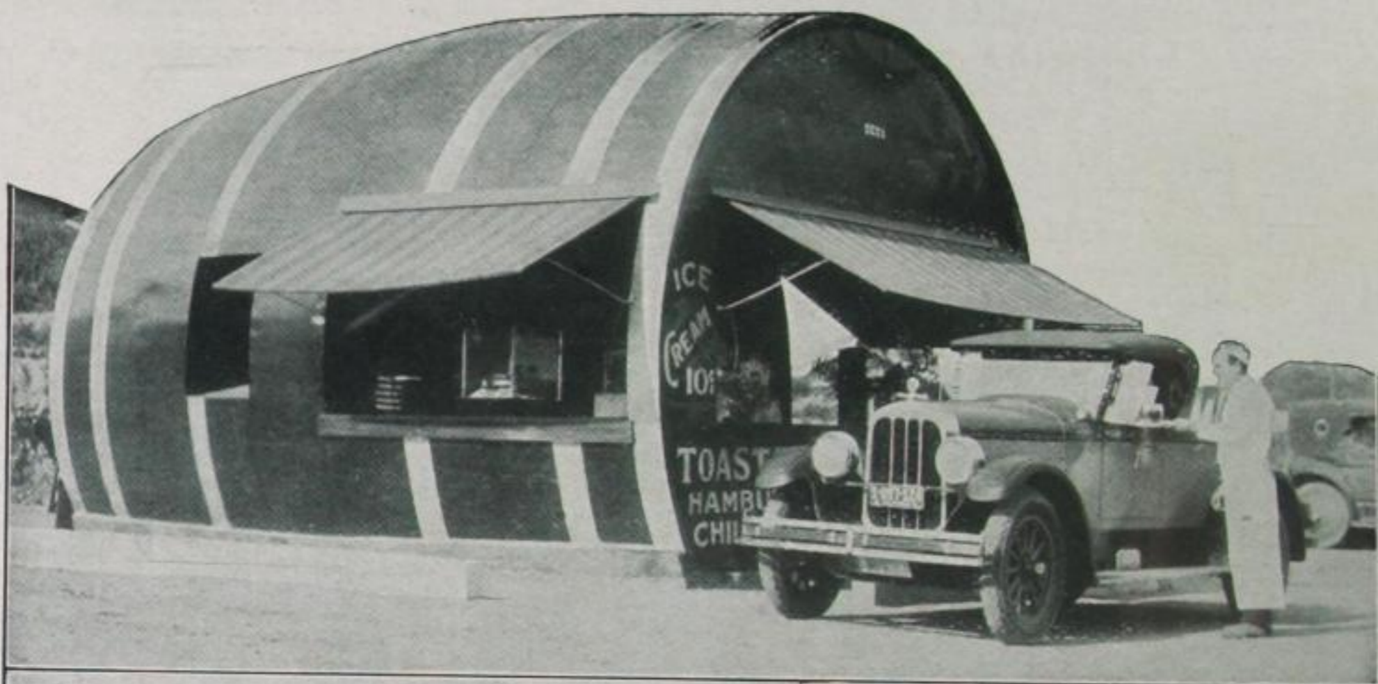
Das Faßhaus, das weithin den Ausschank von Erfrischungsgetränken erkennen läßt