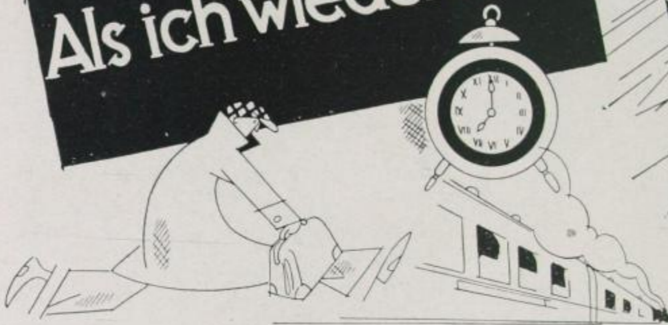
Wer zu spät kommt, darf nachsehen --