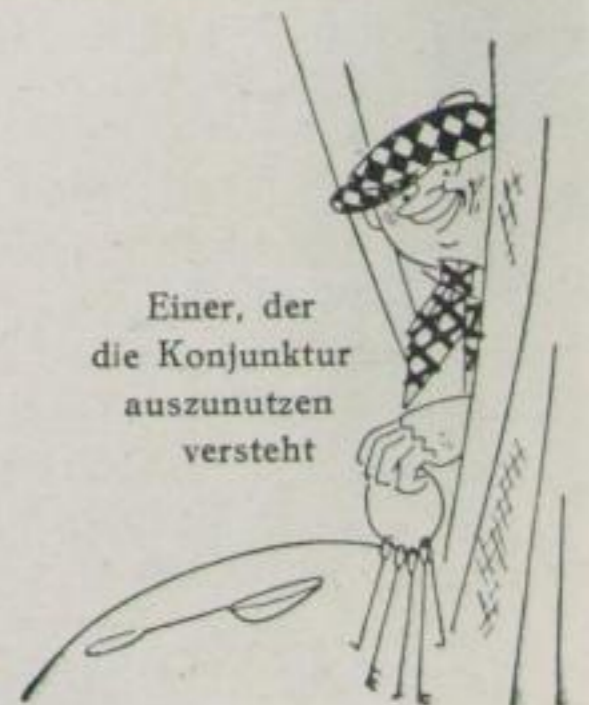
Einer, der die Konjunktur auszunutzen versteht