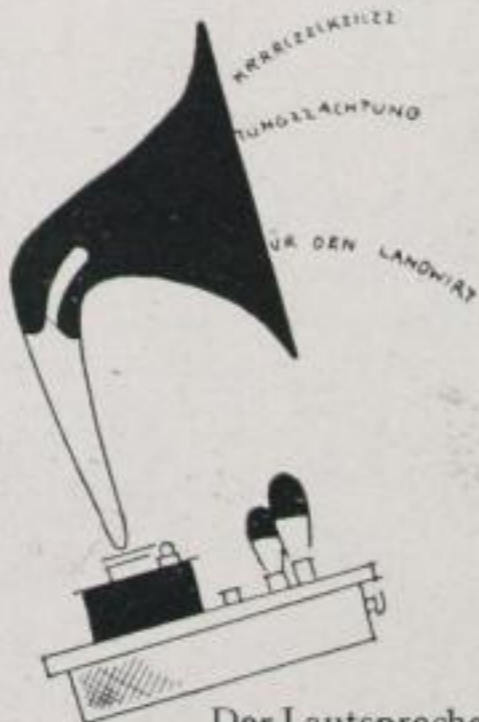
Der Lautsprecher beunruhigte die Nachbarn Tag und Nacht --