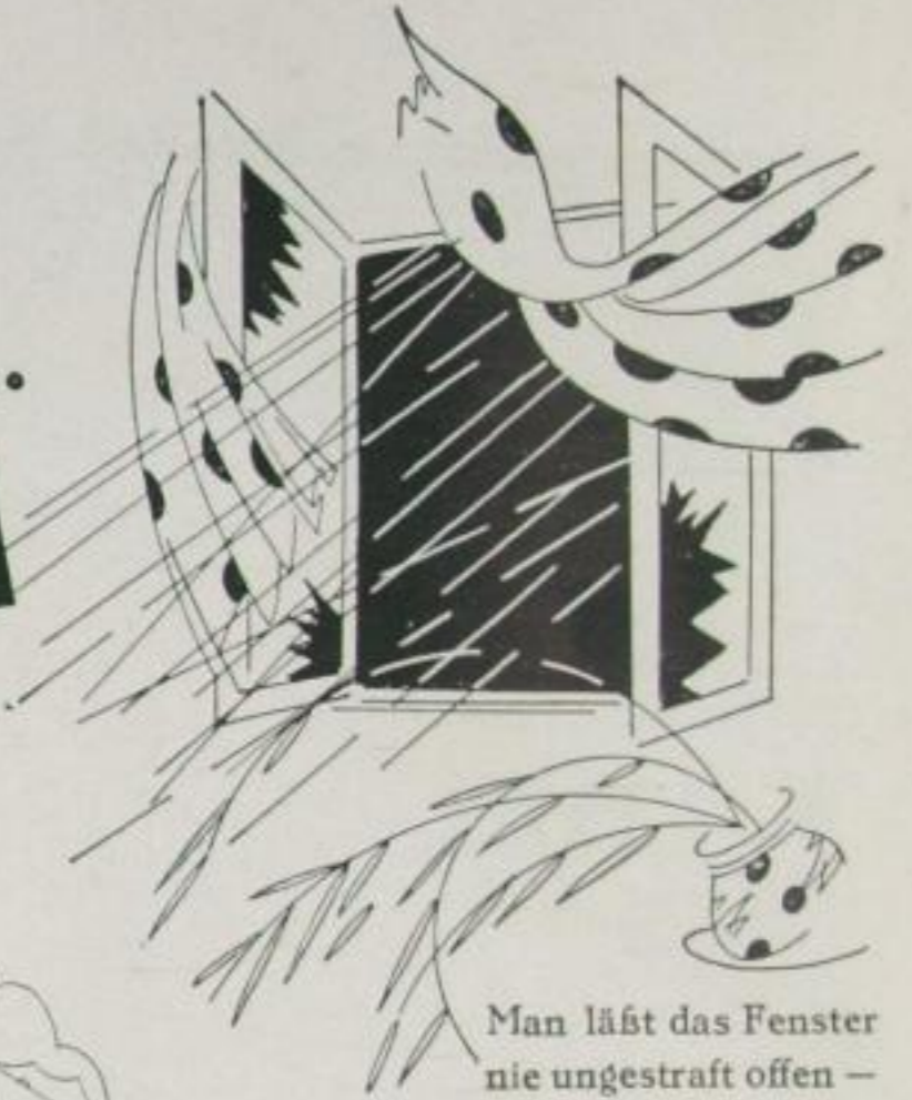
Man läßt das Fenster nie ungestraft offen --