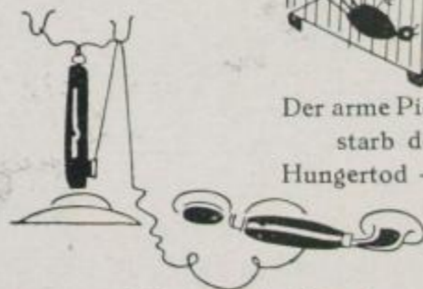
Der arme Piepmatz starb den Hungertod -- --