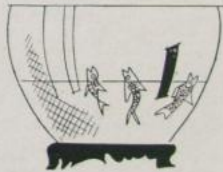
Vergeblich schnappten die Goldfische nach Nahrung --