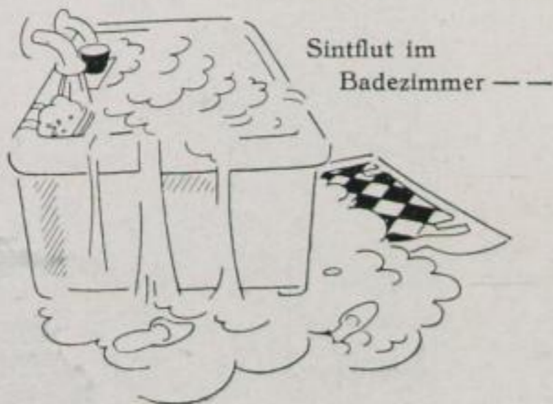
Sintflut im Badezimmer --