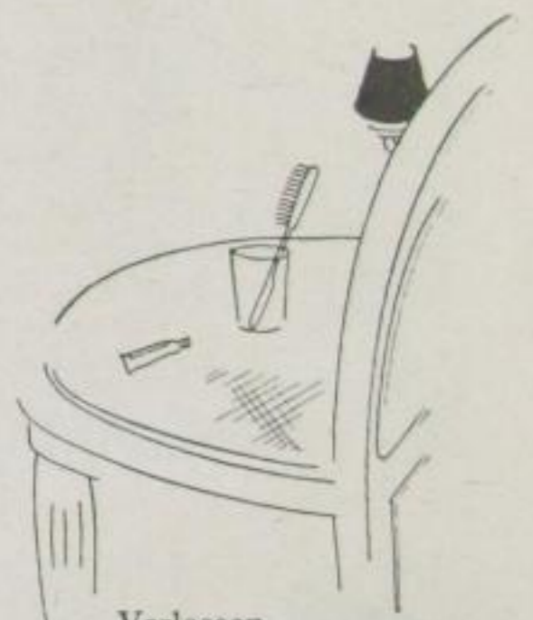
Verlassen trauerte die Zahnbürste ihrem Besitzer nach --