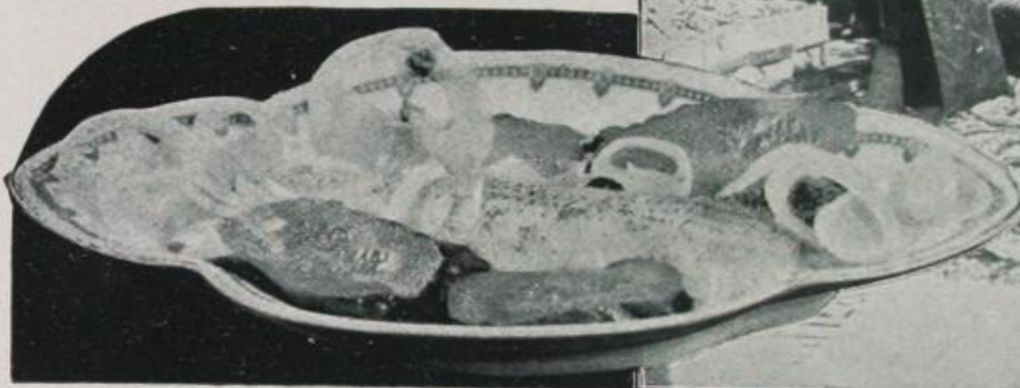
Dem Hering des Hors d'oeuvres machten die Nordseefischer den Garaus