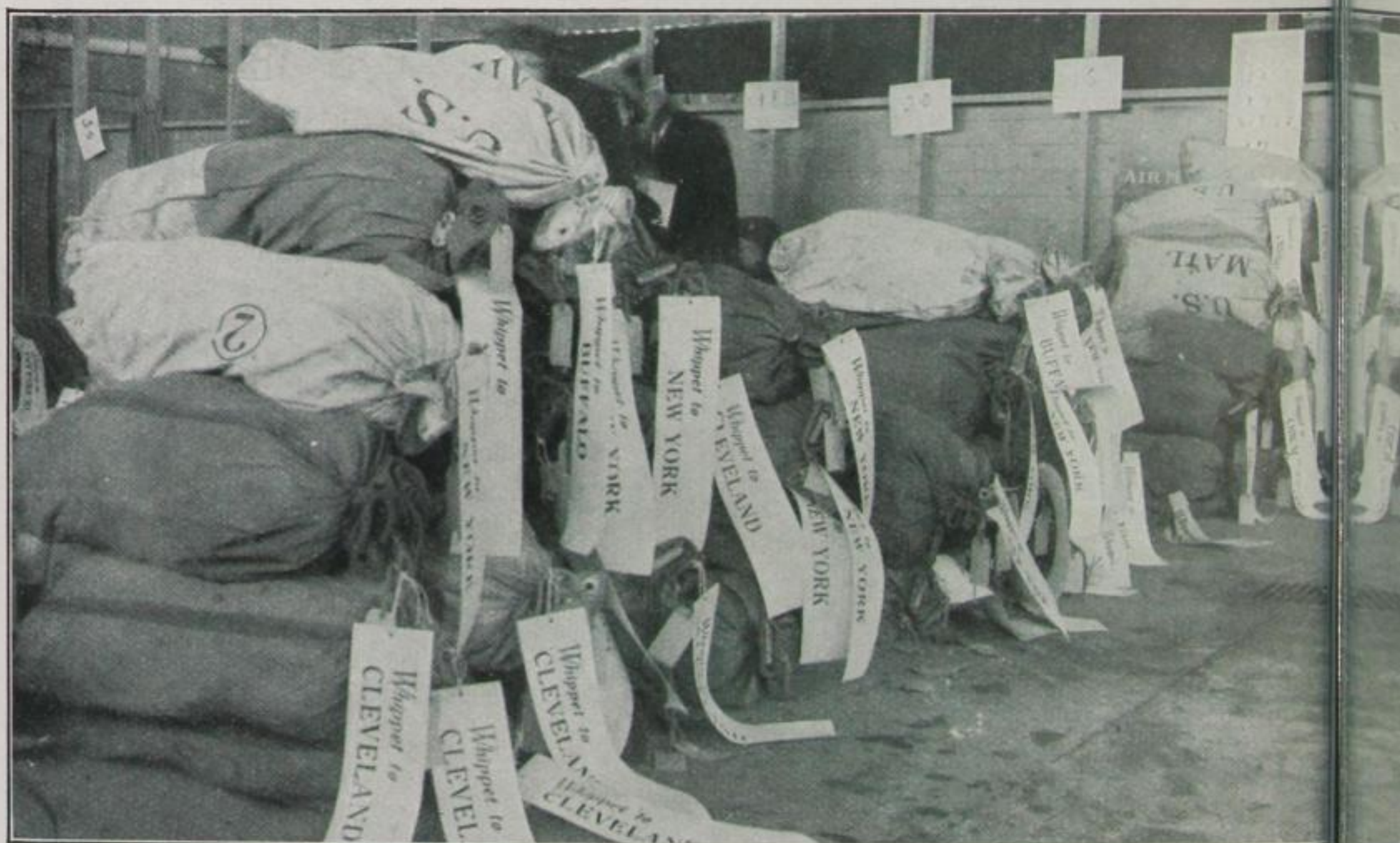
Die Postsäcke harren des Flugzeugs

Luftpostlinien für das Postministerium. Die zurückgelegte Strecke betrug täglich insgesamt 24 000 Meilen (eine amerikanische Meile = 1,6 km), also jährlich 8 760 000 amerikanische Meilen oder 14 016 000 km, also mehr als 350 mal um die Erde. Inzwischen mag sich das Tagesnetz auf mehr als 30 000 km vergrößert haben. Im Jahre 1927 wurden 1,5 Millionen Pfund Post befördert, das sind rund 16 Millionen