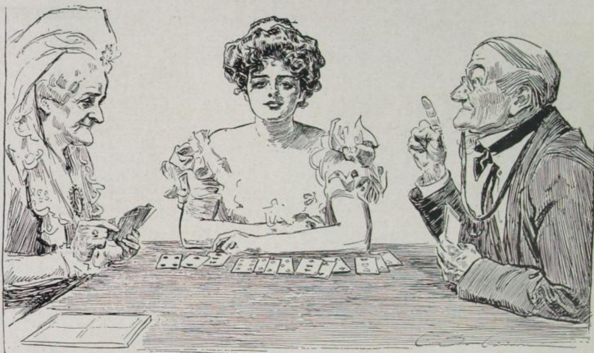
„Unglück im Spiel — Glück in der Liebe!“

Leiter“ hat er sie vereinigt. Unsere Bilder bringen einige Proben dieses Werkes, das, voll der köstlichsten Exemplare, eine unvergleichliche Typensammlung ist.