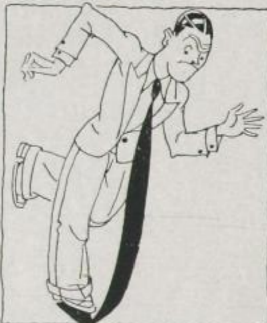
„Tritt Dir man nicht üff'n Schlup!“