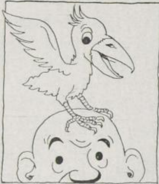
„Dñ hast ja 'n Vogel!“