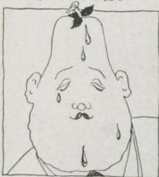
„Mensch Ihre weiche Birne!“