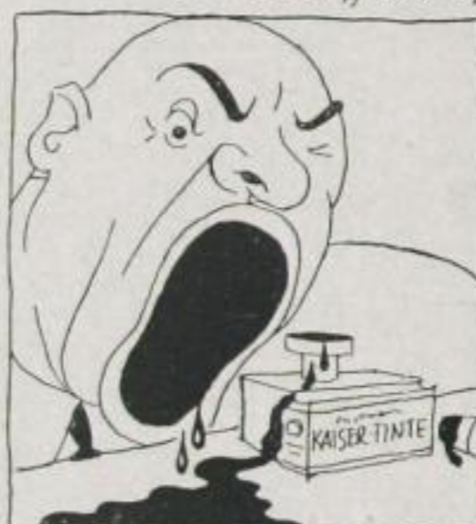
„Dñ hast wohl Tinte gesoffen!“