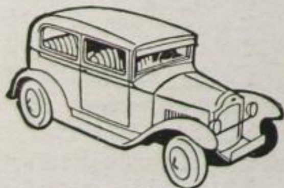
4 PS LIMOUSINE

Kraft selbst bei steilsten Steigungen. Der Wagen, den jedermann fahren muß. Der verbesserte Motor mit wichtigen Änderungen in Kurbelwelle, Ventilsitzen, im Zylinderdeckel und Zylinderkopf gibt Ihnen die Gewähr für gleichmäßige Kompression, ruhiges Fahren und dadurch auch vollste Kraftausnutzung... Der verbesserte Opel entwickelt eine gleichmäßig dahinströmende Kraft