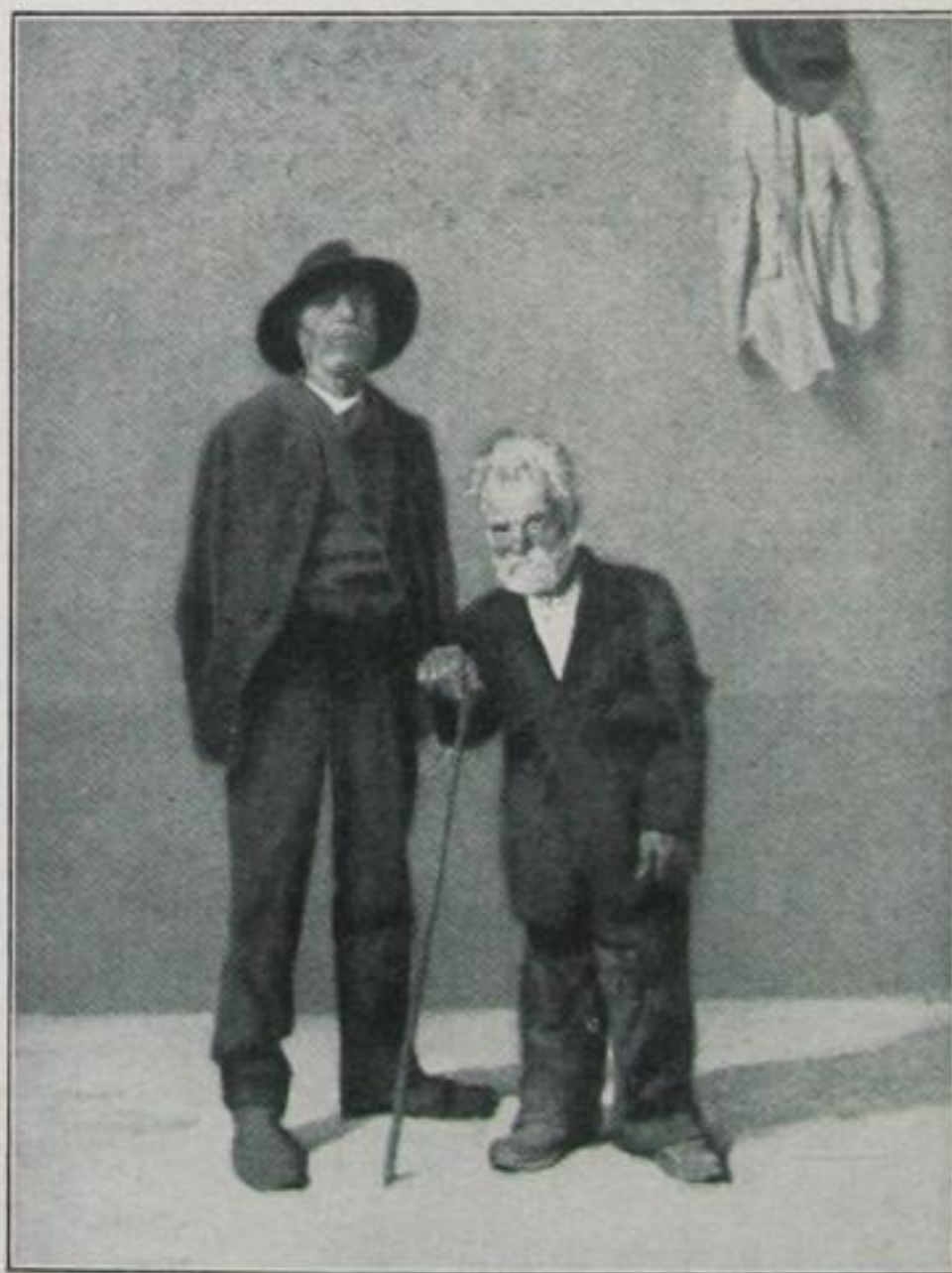
Römische Bettler Malerei von Erich Wolfsfeld