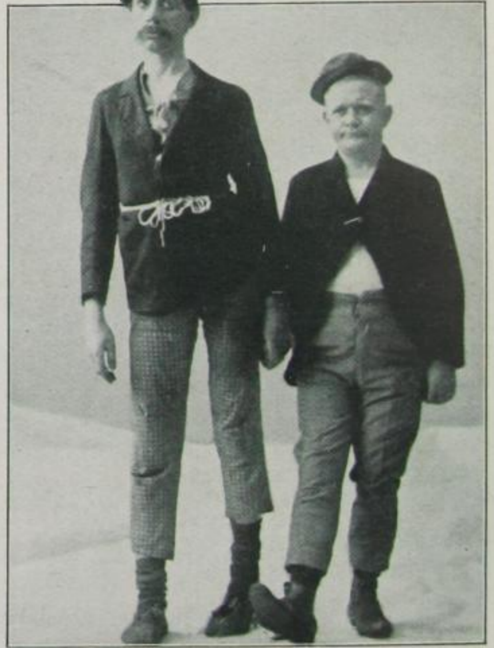
Strolche auf der Leinwand Pat und Patachon