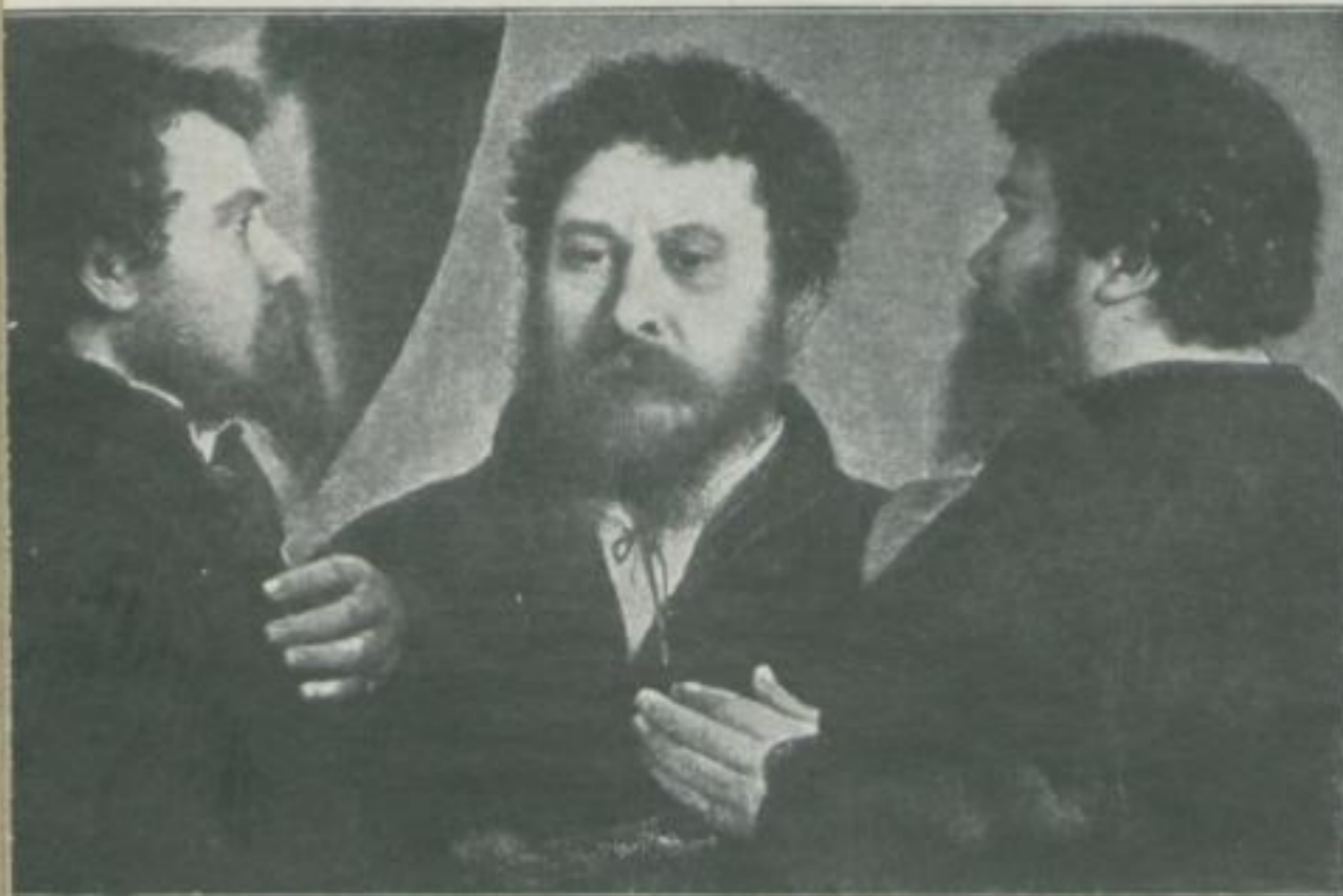
Bildnis eines Mannes in drei Ansichten von Lorenzo Lotto

entspringt, dem glei- chen Bedürfnis, das uns etwa eine Gemäl- degalerie aufsuchen läßt? Und wer von uns wird heute noch einer wirklich künstleri- schen Photographie — deren es ja im Film eine Unmenge gibt — ihren Wert abspre- chen? — Maler und Operateur, beide grei- fen ihre Motive aus dem Leben, und wie nahe sie dabei einan- der in der Ausführung kommen können, zei- gen die beiden Hirten- landschaften, bei de- nen wir die Malerei