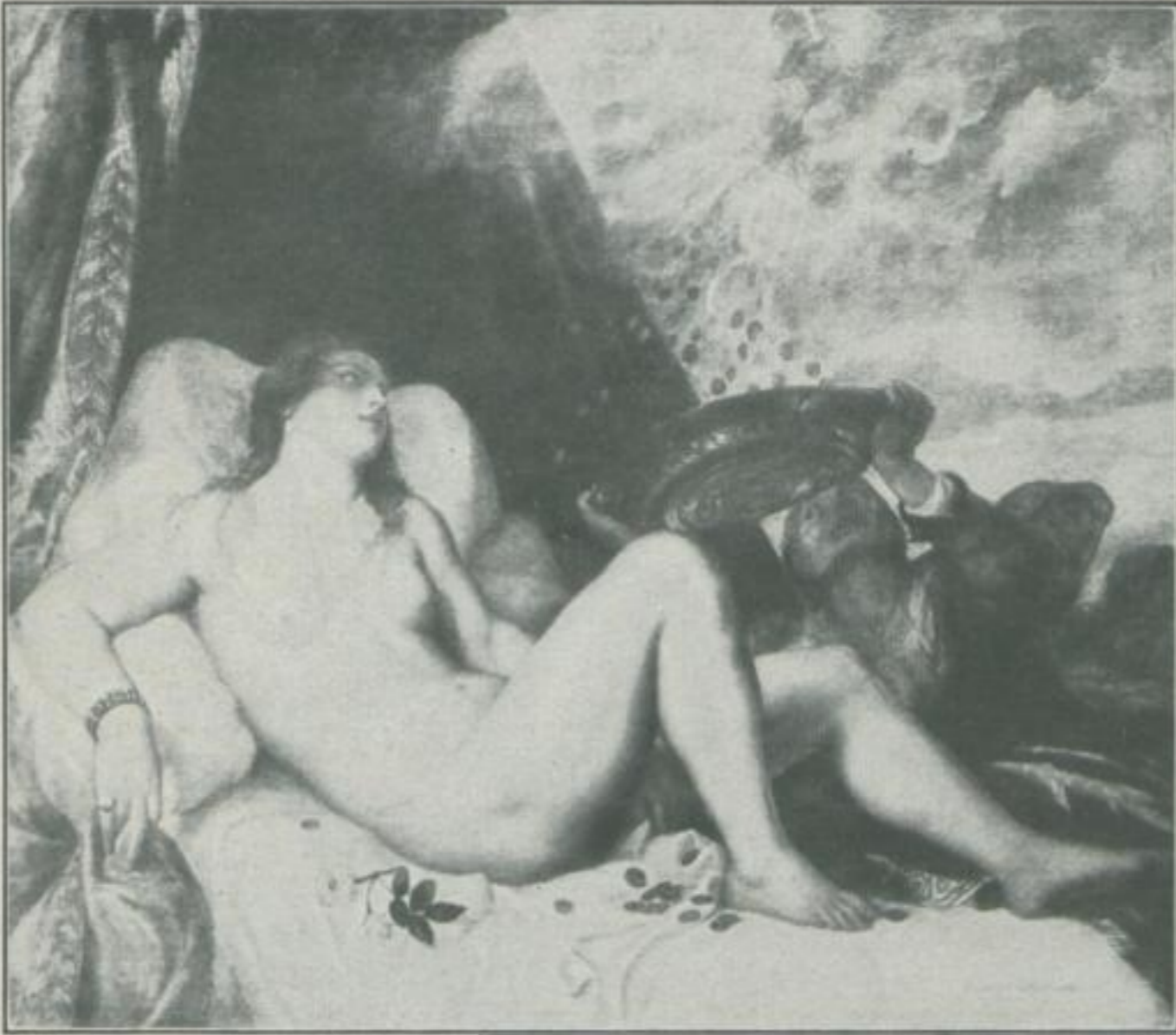
„Jo und der Goldregen“, wie Tizian es sah und —

nur darum so leicht von der Photographie unterscheiden, weil das Milletsche Bild allzu bekannt ist.