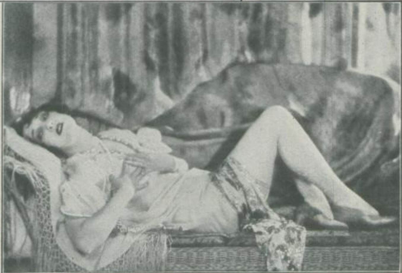
wie es jedermann heute von der Leinwand bekannt ist

Photographie und Malerei, beide erfor- dern Sinn für Kom- position, Luft-, Licht- und Schattenwirkung, und sicherlich kann der Operateur darin zu den großen Meistern der Malerei in die Schule gehen! Die