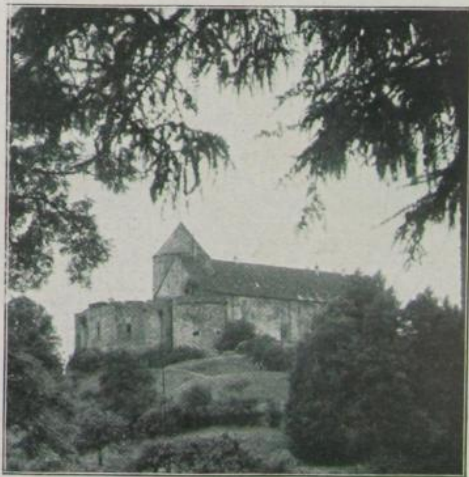
Schloß Waldeck (Schluß auf Seite 4778)

Sogenannte Quellensalze werden aus dem Wildunger Wasser nicht hergestellt,