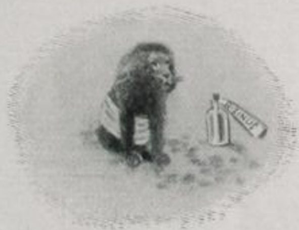
Kein guter Schütz' bei ihnen war — — Der Löwe bekam Darmkatarrh.