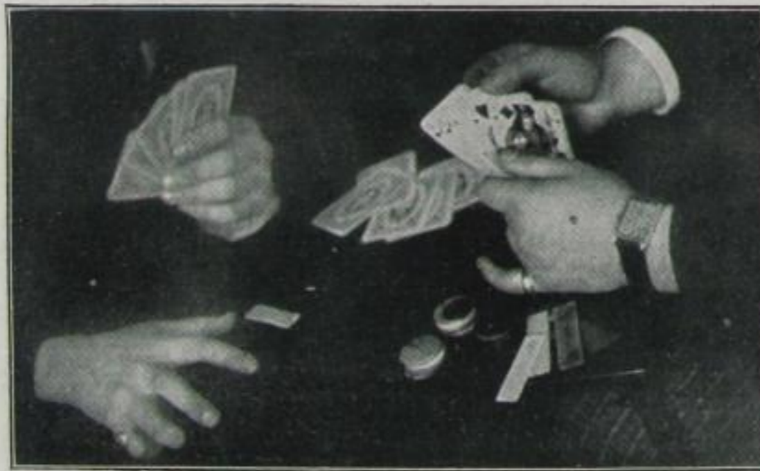
Poker ist ein schönes Spiel, Doch verliert man leicht sehr viel.