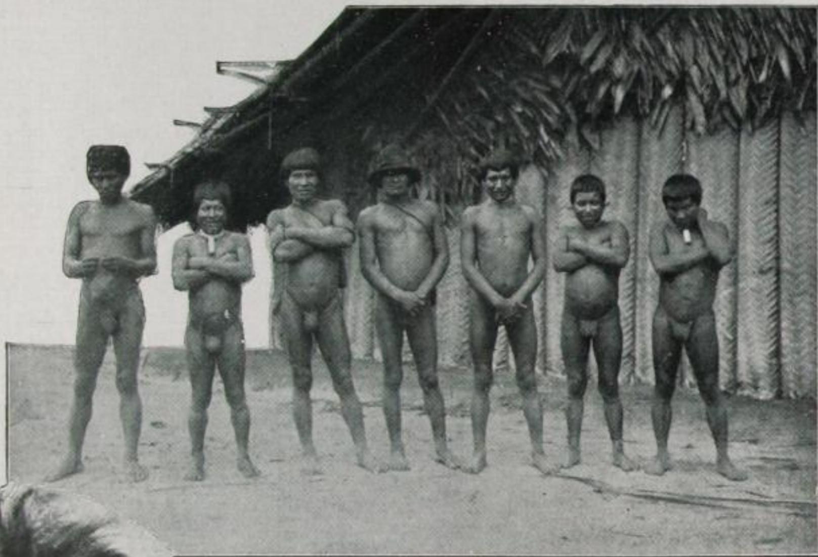
Sieben Neger, gänzlich nackt, Die gingen auf die Löwenjagd.