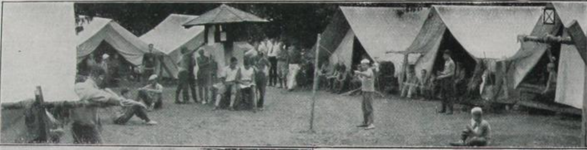
Das typische „Boylager“ amerikanischer Jungs

sondere Merkwürdigkeit aus. Dort kommen die meisten Weekender in ihren eigenen Sportwagen heraus, um in ihren Wohnwagen auf Gummirädern zu übernachten. Die ganze Kolonie solcher Wohnwagen, zu der ein eigener Sportplatz, eigene Er-