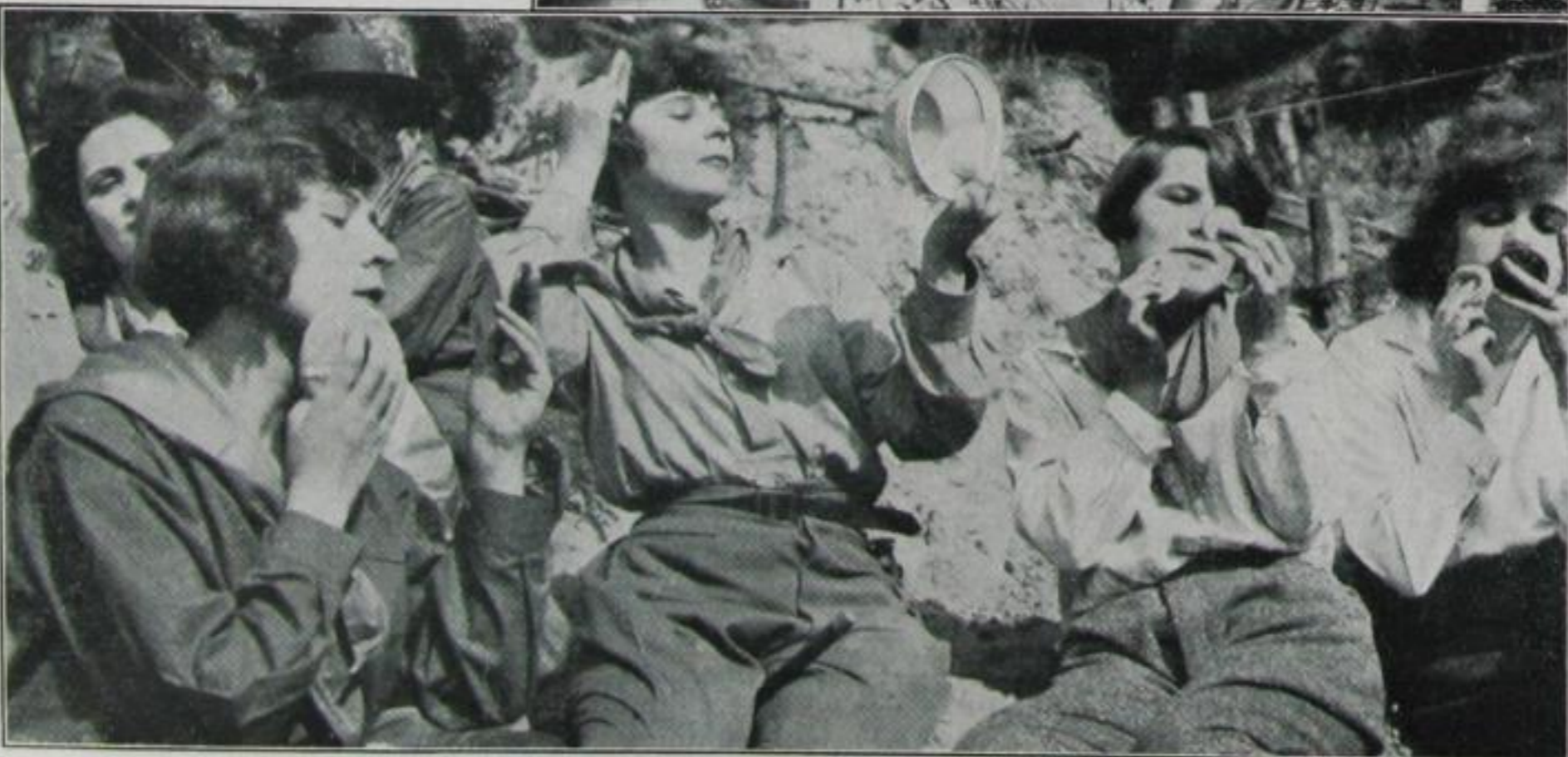
Gibt es eine Gelegenheit, für die sich Frauen nicht pudern?