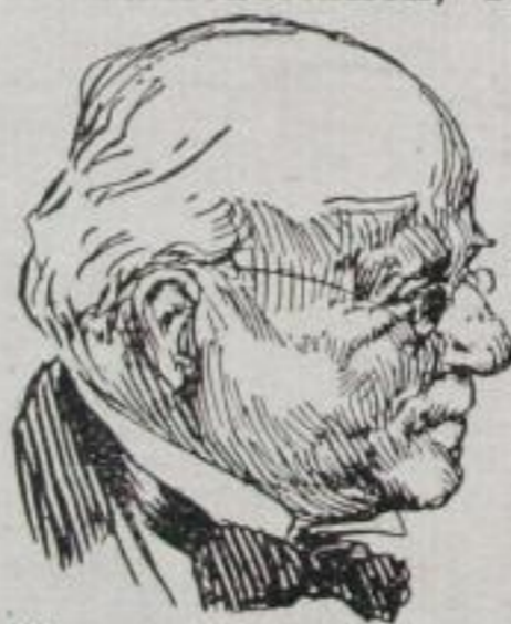
Eine meisterhaft ausgeführte Federzeichnung eines A B C-Schülers nach siebenmonatigem Unterricht

Bedeutende Lehrkräfte unterweisen Sie durch individuellen Briefunterricht in der von Ihnen gewünschten Art des Zeichnens: Skizze, Landschaft, Porträt, Karikatur, Illustration von Büchern, Reklamezeichnen, Plakatmalen, Dekoration, Mode usw.