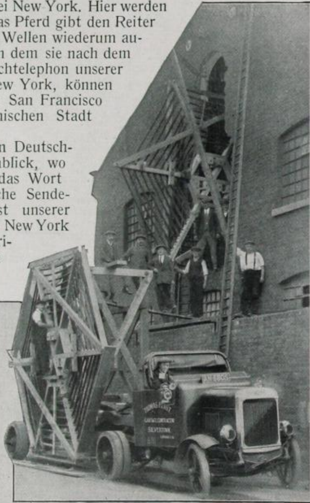
Die Spulen der Station Rugby zur Abstimmung der Wellenlänge sind so groß, daß die Seitenwand des Hauses, in dem sie gebaut wurden, für den Abtransport aufgebrochen werden mußte.

Auf diesem Wege haben wir von Deutschland aus gesprochen. In dem Augenblick, wo wir schweigen und unsere Cousine das Wort ergreift, stellt sich die amerikanische Sendestation Rocky Point in den Dienst unserer Unterhaltung. Die Stimme fließt von New York oder von irgend einer sonstigen amerikanischen Stadt aus im Draht dorthin und wird in Rocky Point von den