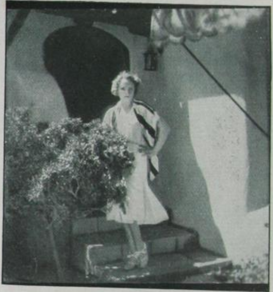
Vor meinem Bungalow

es doch ein Paradies. In dem allerdings alle Bewohner mit Rolls Royces (wer auf sich hält, tut's nicht drunter) fahren und in dem den ganzen Tag Sphärenmusik erklingt aus Radio-Apparaten in einer Vervollkommnung, wie ich sie noch nie gehört habe. In den Studios riecht es genau so wie bei uns. Wenn einen mal die Sehnsucht nach Hause packt (und das tut sie oft), findet man hier die Heimat wieder! Man wohnt in Bungalows, kleinen Miniaturvillen parterre, die nie verschlossen werden, und badet in Swimming Pools, die sich hinter dem Hause befinden und vor und nach der Atelierarbeit die schönste Erholung sind. M. D.