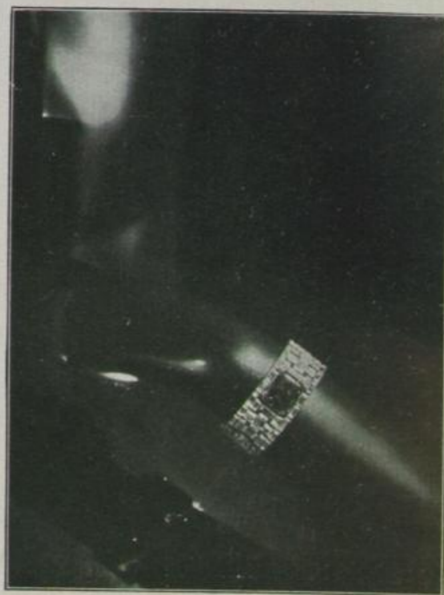
Armband auf Holzmannequin