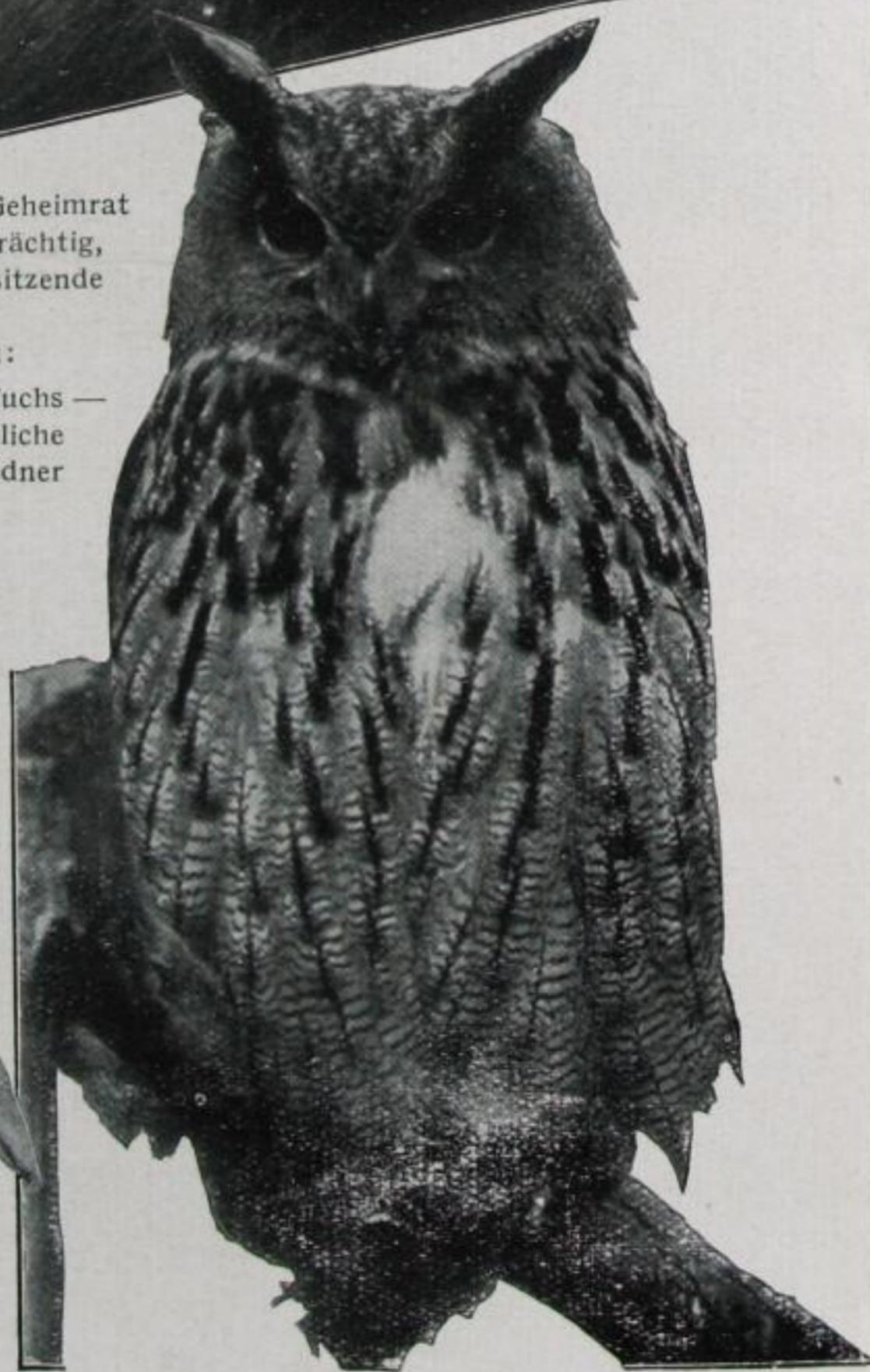
Rechts: Wachsam und stumm hörte Frau Professor Eule der Rede des Vorsitzenden zu