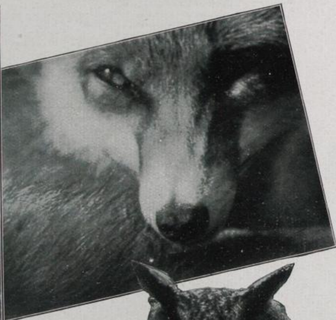
Links: Geheimrat Niederträchtig, der Vorsitzende