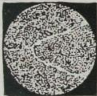
Querschnitt eines gesunden Nervenzündels

Warum ermüden wir, ehe unser Wille am Ende ist? Warum müssen wir, kaum erwachsen, unweigerlich so bald altern? Bietet die Natur kein Mittel, sich der Kräfterschöpfung sowie des leidigen Alterns zu erwehren? Wir wissen heute: Müdigkeit und Ermattung entstehen durch Ablagerung schlackenartiger Stoffe, der Ermüdungstoxine. Diese zu beseitigen, brauchen die Nerven ausreichende Nährstoffzufuhr.