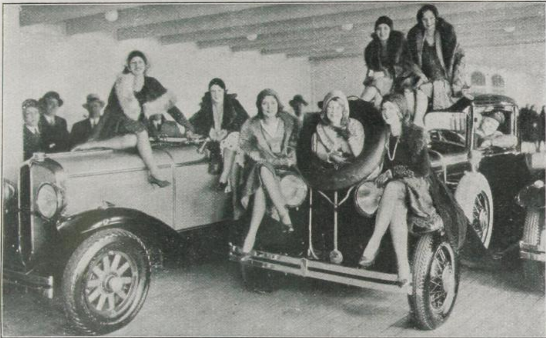
Amerikanische Teilnehmerinnen treffen mit ihren Wagen zur Konkurrenz ein

D IE SAISON an der Côte d'Azur beginnt mit der ersten Autokonkurrenz. Es ist in Amerika Mode geworden, den Trip nach Europa im eigenen Wagen zu machen. Die riesigen Ozeandampfer mit ihren schwimmenden Garagen machen es einem ja auch zu bequem. Man fährt die Wagen direkt auf das Autodeck des Schiffes, das Benzin wird entleert, die Bremsen angezogen, die Räder blockiert und eine Woche später fährt man mit frischem Benzin wieder von Bord. Da wird die Beteiligung an der Autokonkurrenz zur Selbstverständlichkeit. Man sieht leider verhältnismäßig wenige deutsche Wagen auf diesen internationalen Konkurrenzen, auf denen allerdings fast stets nur hundertpferdige Riesen-Wagen in die engere Wahl kommen.