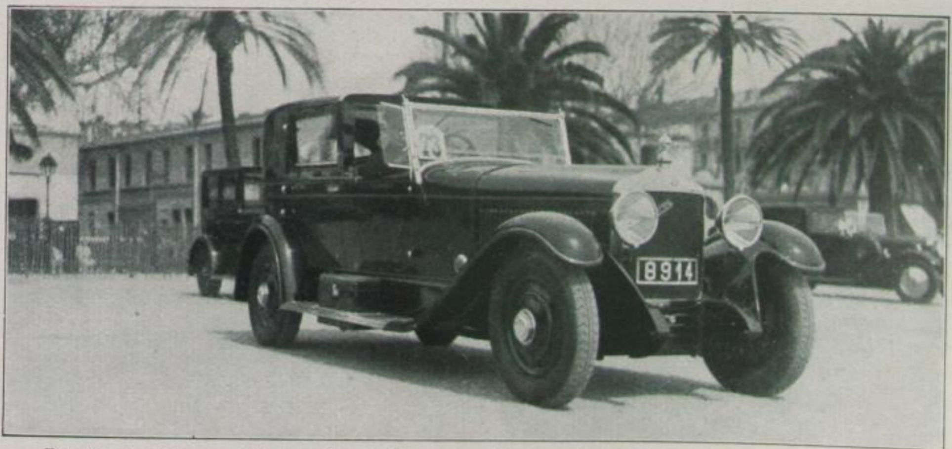
Die ebenho zschwarze Minerva-Coupé-Limousine, die den „Grand Prix von Monte Carlo“ erhielt