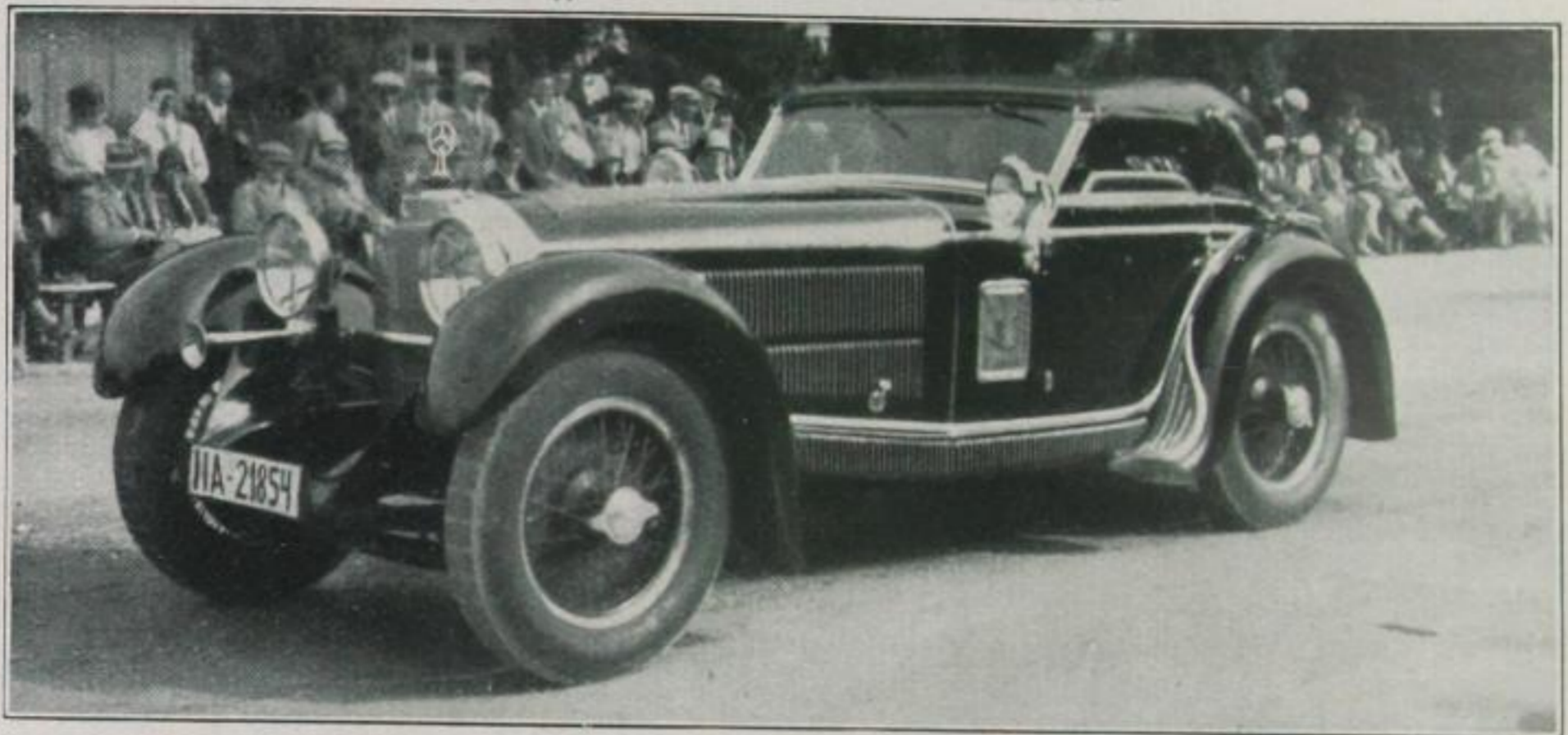
Das preisgekrönte Mercedes-Benz „SS“-Cabriolet des Grafen Arco Zinneberg