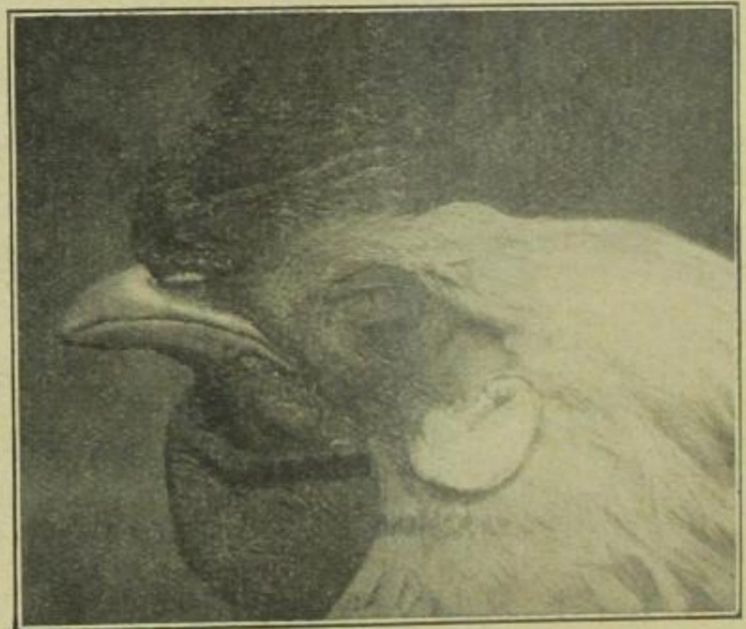
Der Gockel läßt die Aufnahme phlegmatisch über sich ergehen

Der Mensch, der vor der Kamera steht, gibt sich immer einen inneren Ruck; und selbst, wenn er von ihr, wie es der neue Photo-Brauch will, „überfallen“ wird, bleibt noch in der letzten Tausendstelsekunde seiner Überraschtheit ein geistesgegenwärtiges Stück von Sammlung zurück. Wirklich überrascht und überfallen