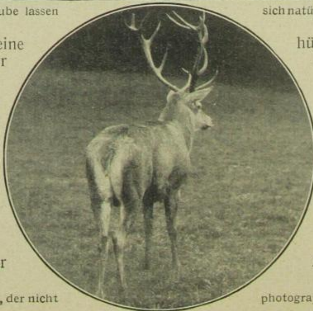
Einer, der nicht

oder „Die Wespe ist eine kokette Dame“ oder „Die Elster ist eine gute Mutter“ — die Familiarität und Betulichkeit des Tierreichs kann uns doch nie so vorsintflutlich und vergilbt anschauen wie die Photos aus Großmamas Familienalbum. — Es ist sehr