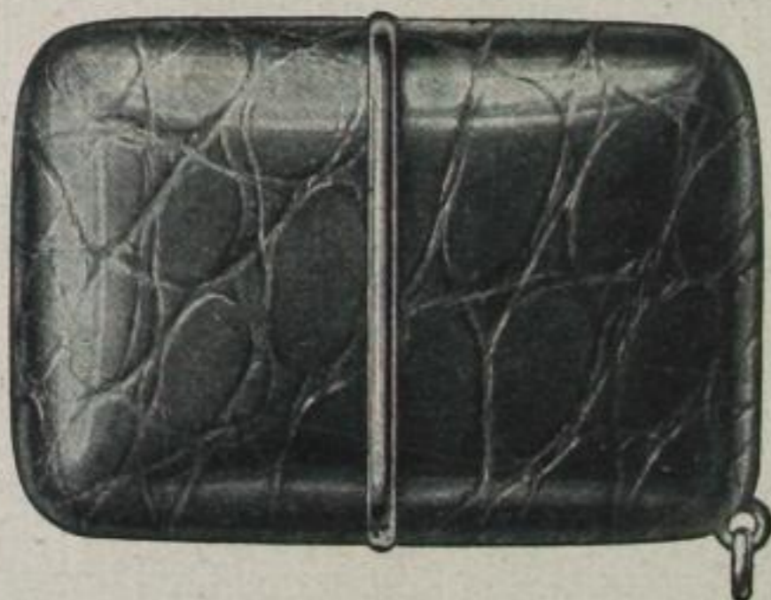
„ermeto“-„MASTER“, geschlossen, mit gewöhnlichem Aufzug von RM. 96.— an.