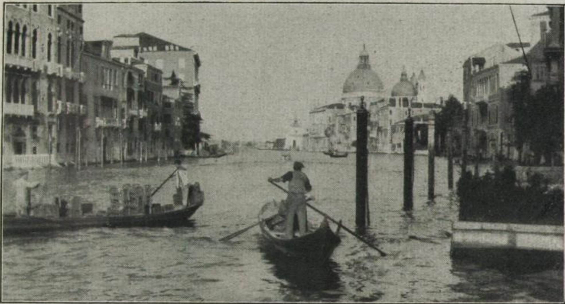
... Unvergeßlich die Fahrt vom Schiff über den Canale grande zum Markusplatz ... Auf Agja-Film