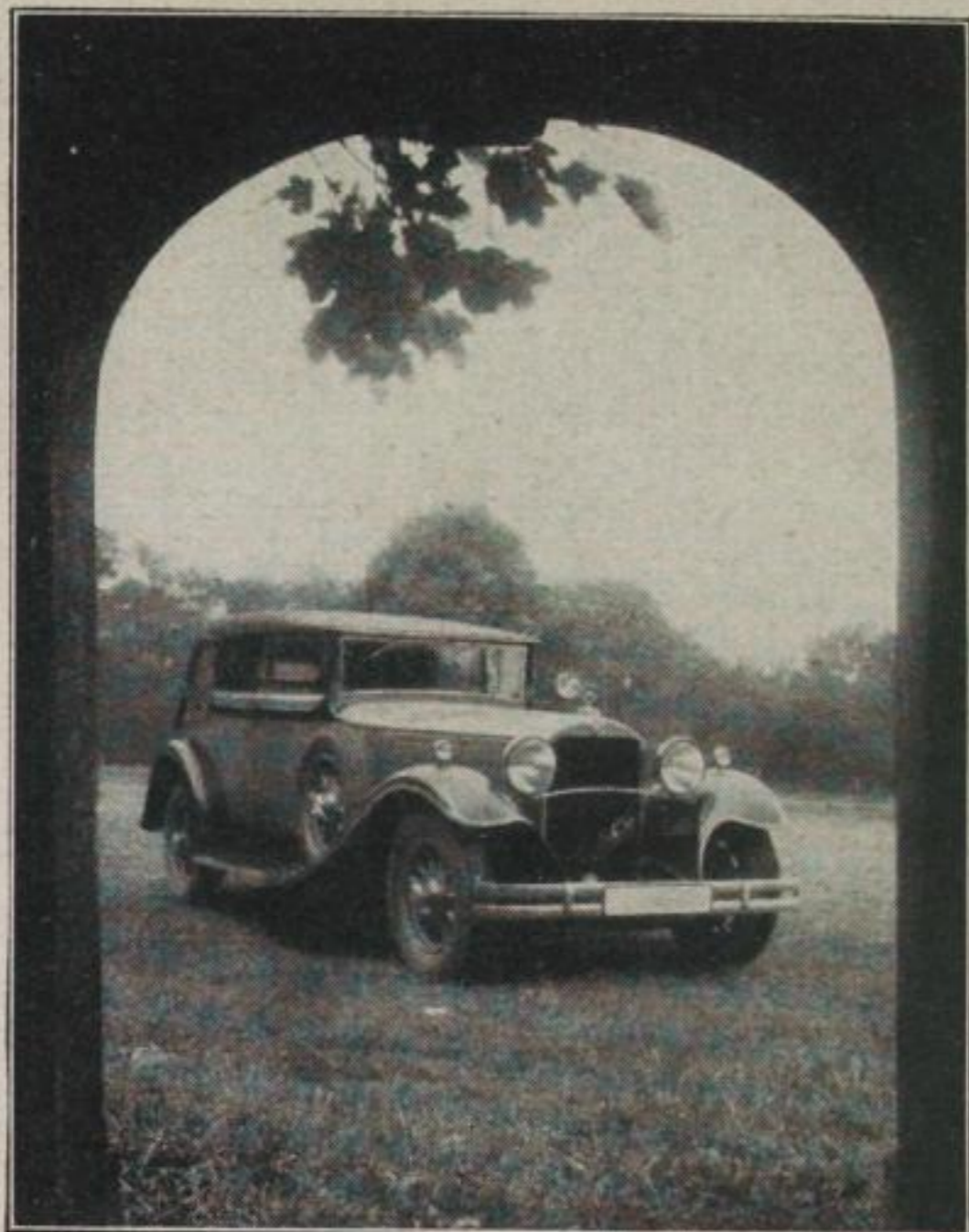
Mercedes-Benz Cabriolet, Typ Nürburg

E IN Rückblick auf die Berliner Ausstellung 1931 hat gezeigt, daß die Entwicklung im Automobilbau gegenwärtig nach zwei Richtungen geht. Einesteils nach einer Steigerung in Bezug auf Leistung und Ausstattung der