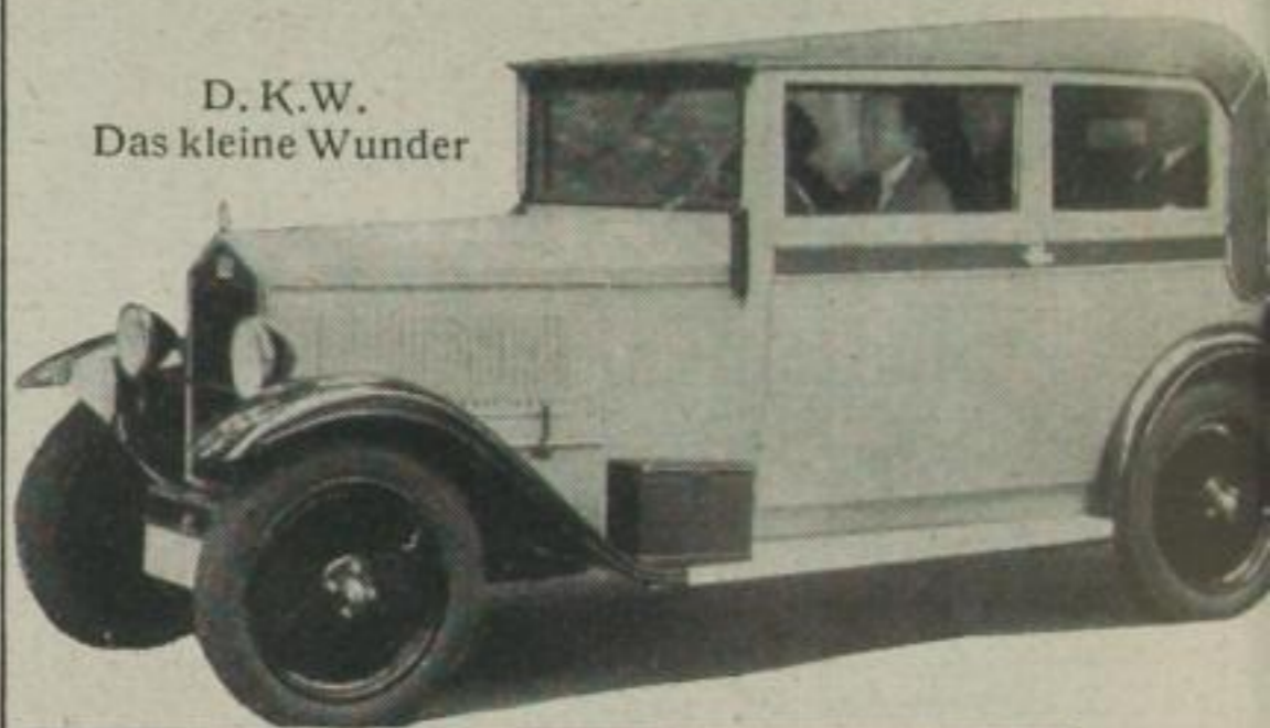
D. K. W. Das kleine Wunder