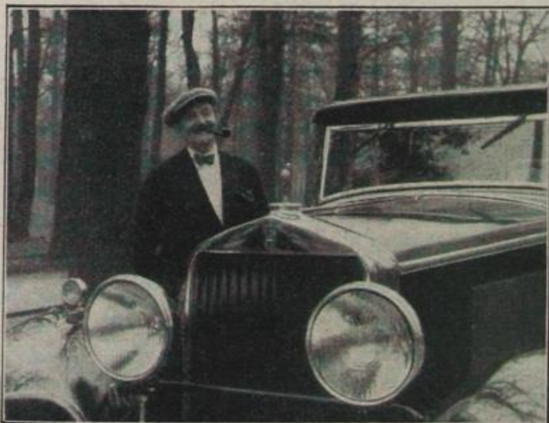
Neofot-Fotag Seit gestern Besitzer von 8 PS Der Flugzeugkonstrukteur August Euler mit seinem neuen Horchwagen