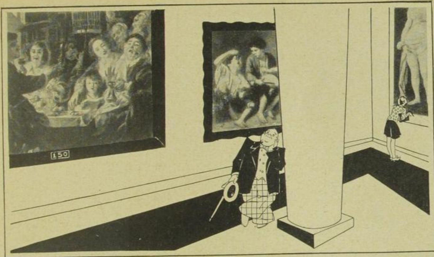
Er schwelgte in imaginären Festgelagen