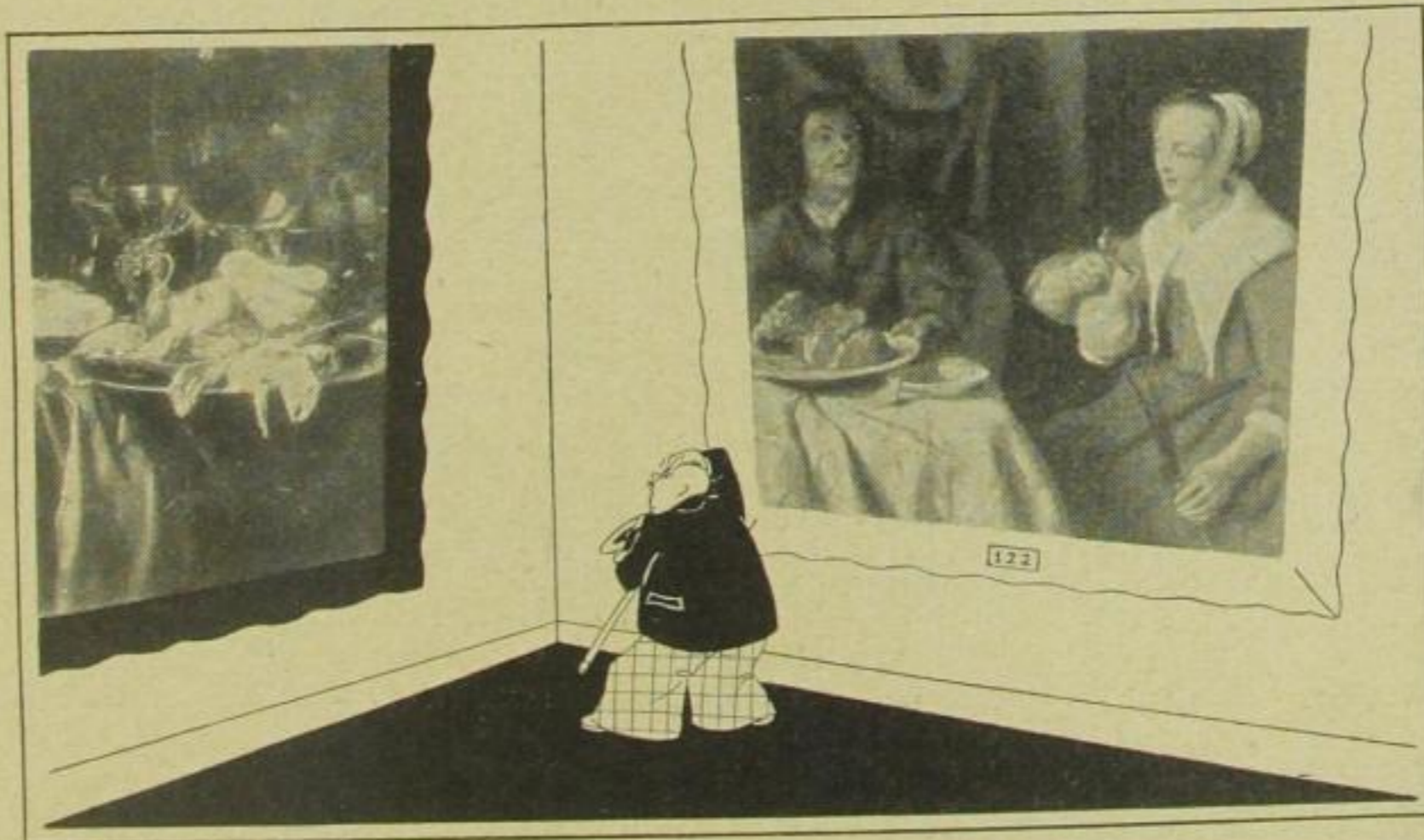
— und ein Austernstilleben trieb ihn zur Raserei,