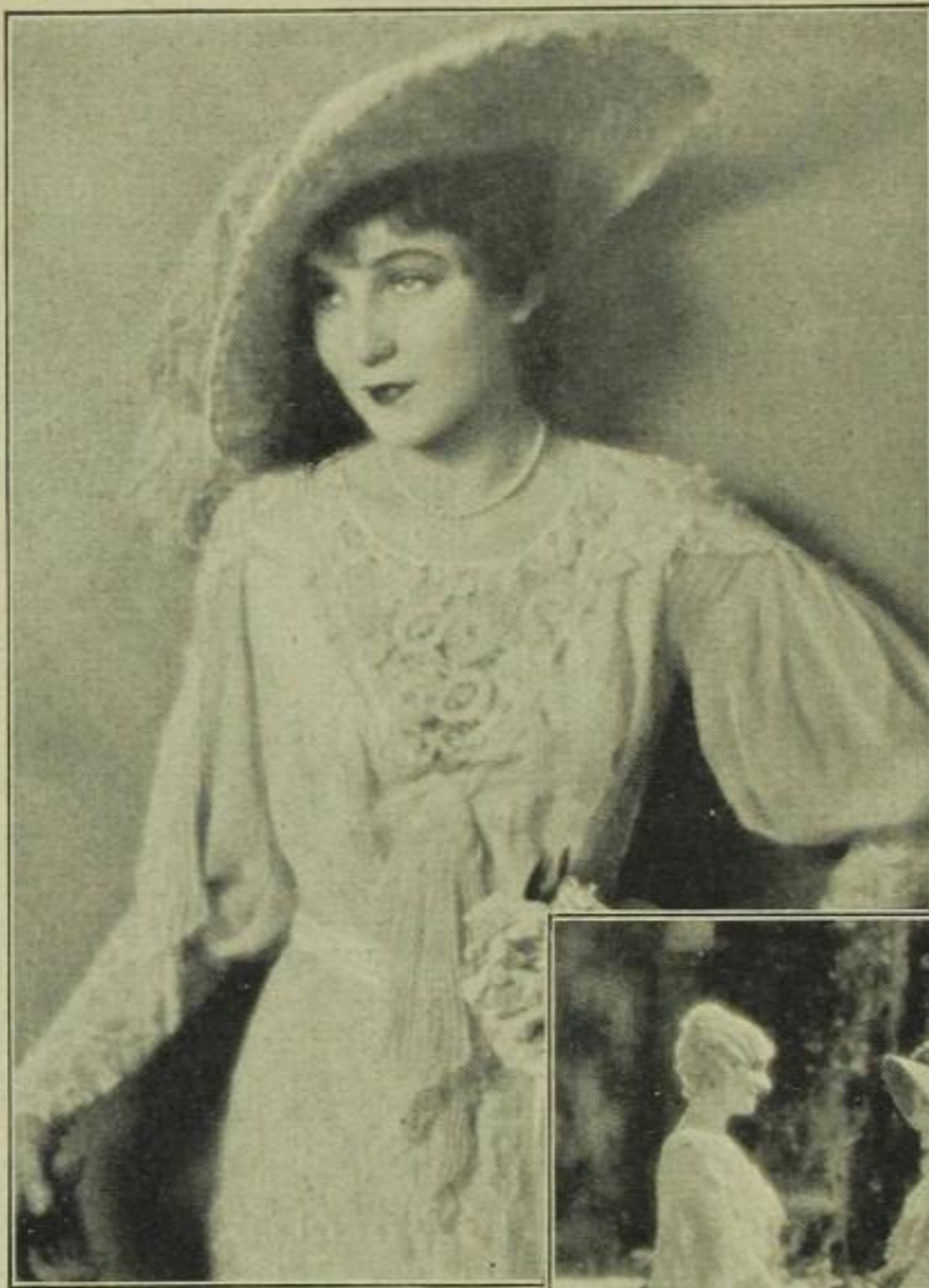
So sah die Frau mit Seele aus dem Jahre 1900 aus

Anno 1880: Fraulich vom Scheitel bis zur Sohle