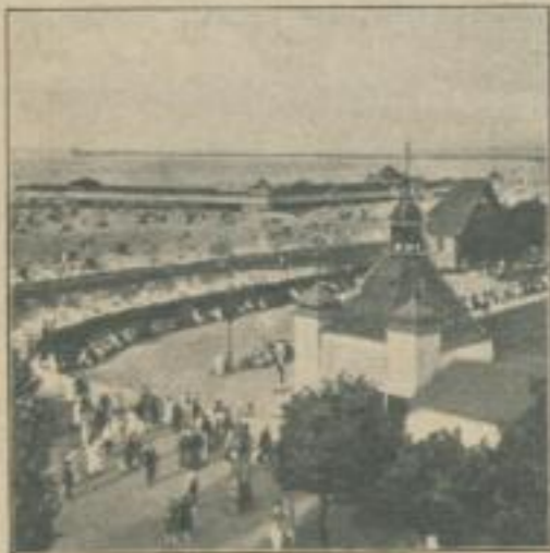
Seebad Swinemünde: Vor dem Kurhaus