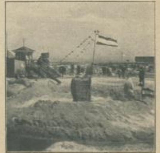
Seebad Swinemünde: Strand