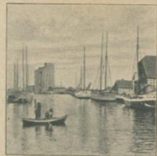
Anklam: Hafen und Bollwerk