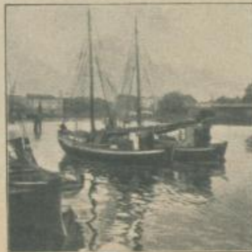
Seebad Swinemünde: Hafenbild