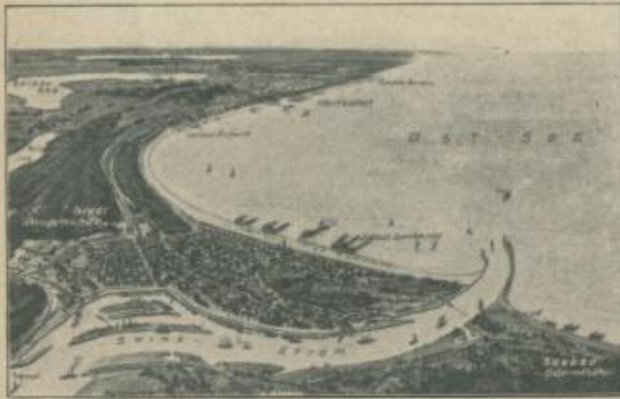
Gesamtansicht der Küste