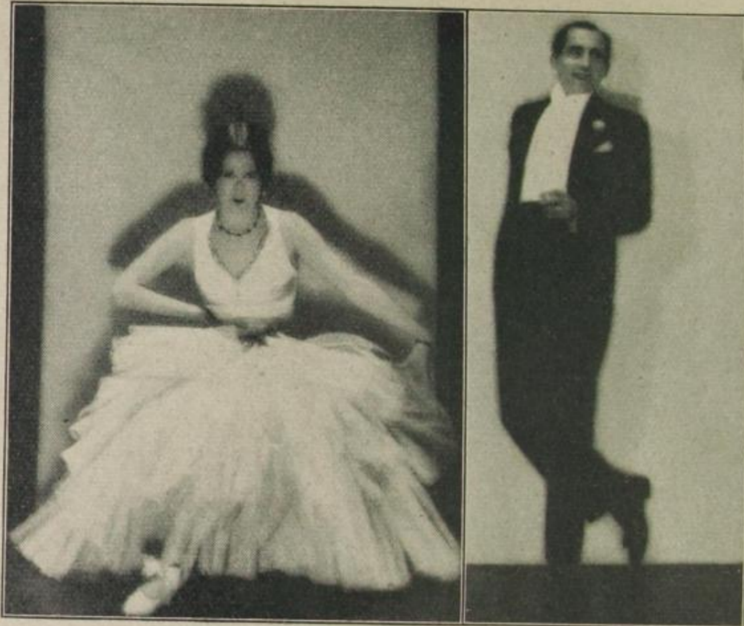
Die berühmten „Ballroom- dancers“ De Marcos