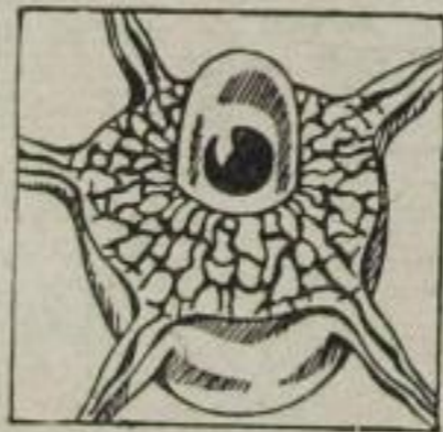
Kraftstrotzende Nervenzelle am Morgen

Schauen wir uns einmal eine Nervenzelle am Morgen an, wie sie frühmorgens ihren Dienst beginnt. Drall sieht sie aus, nach flandrischem Schönheitsideal üppig rund und kraftstrotzend, wie eine Rubens'sche Bacchantin, schmuckbeladen, traubenüberhängen. Gelbe, graue und weiße Tropfen zieren ihren Leib, sie muten an wie Perlenschnüre und Bernsteinketten und sind die edelsten Stoffe dieser Welt: Gelbe Edelfette, Lecithin, die köstlichsten Essenzen, die der Mensch sich denken kann... sie sind die Delfeuerung unserer Lebensmaschine, die Brennmaterialien für