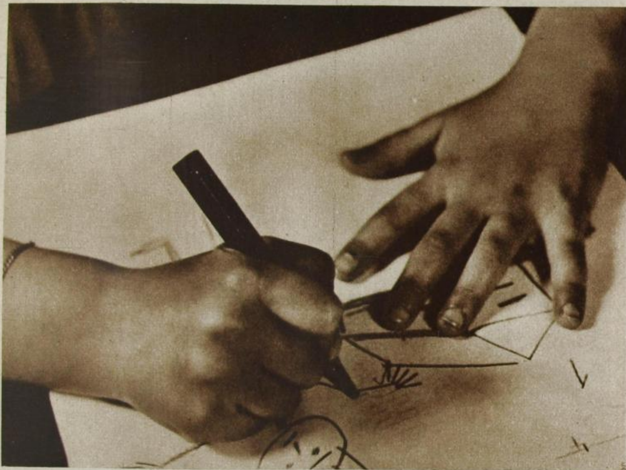
Punkt, Punkt, Komma, Strich — fertig ist das Rundgesicht