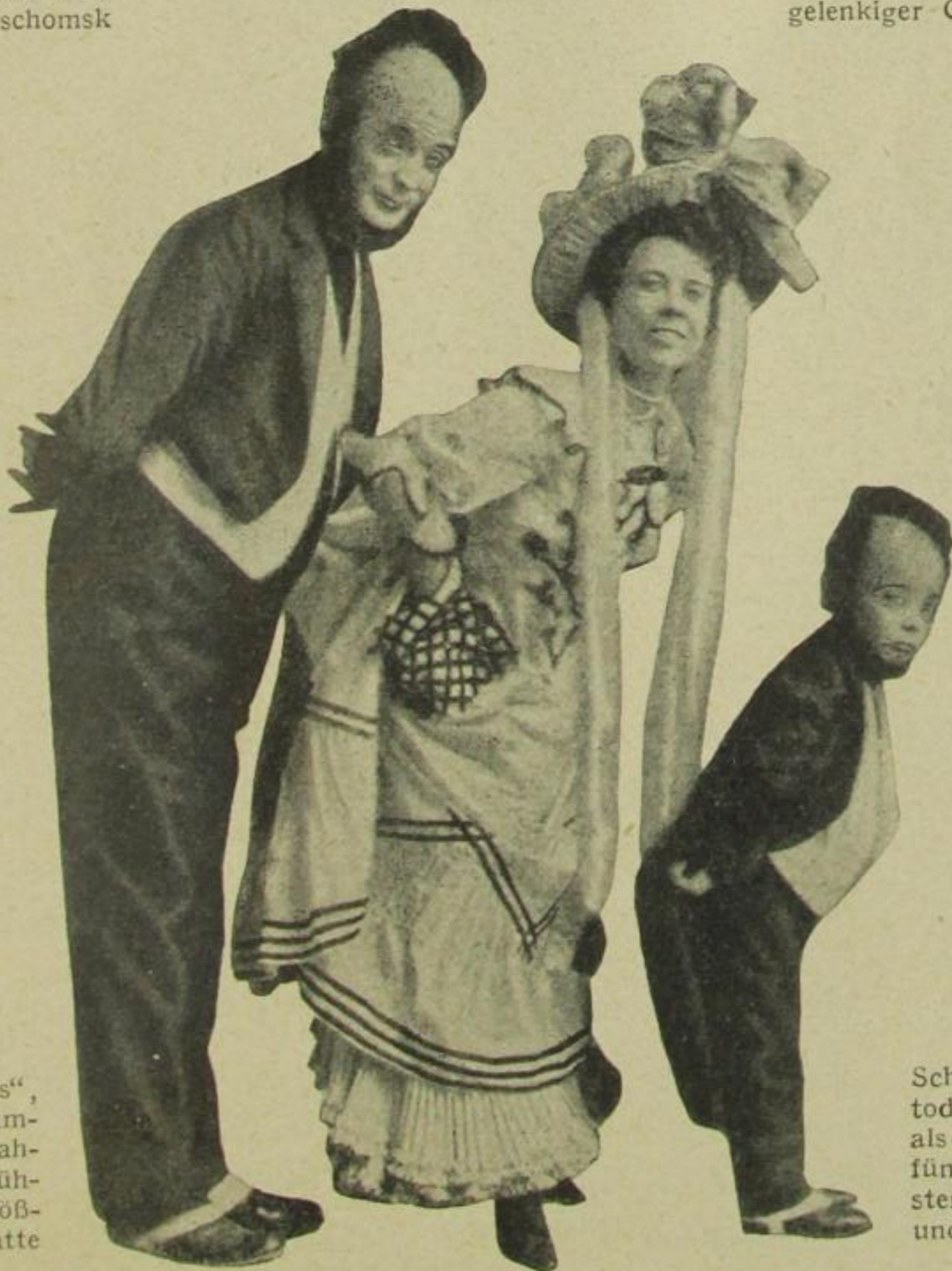
„Die drei Keatons“, eine komische Nummer, die vor 30 Jahren auf Varietébühnen den allergrößten Erfolg hatte