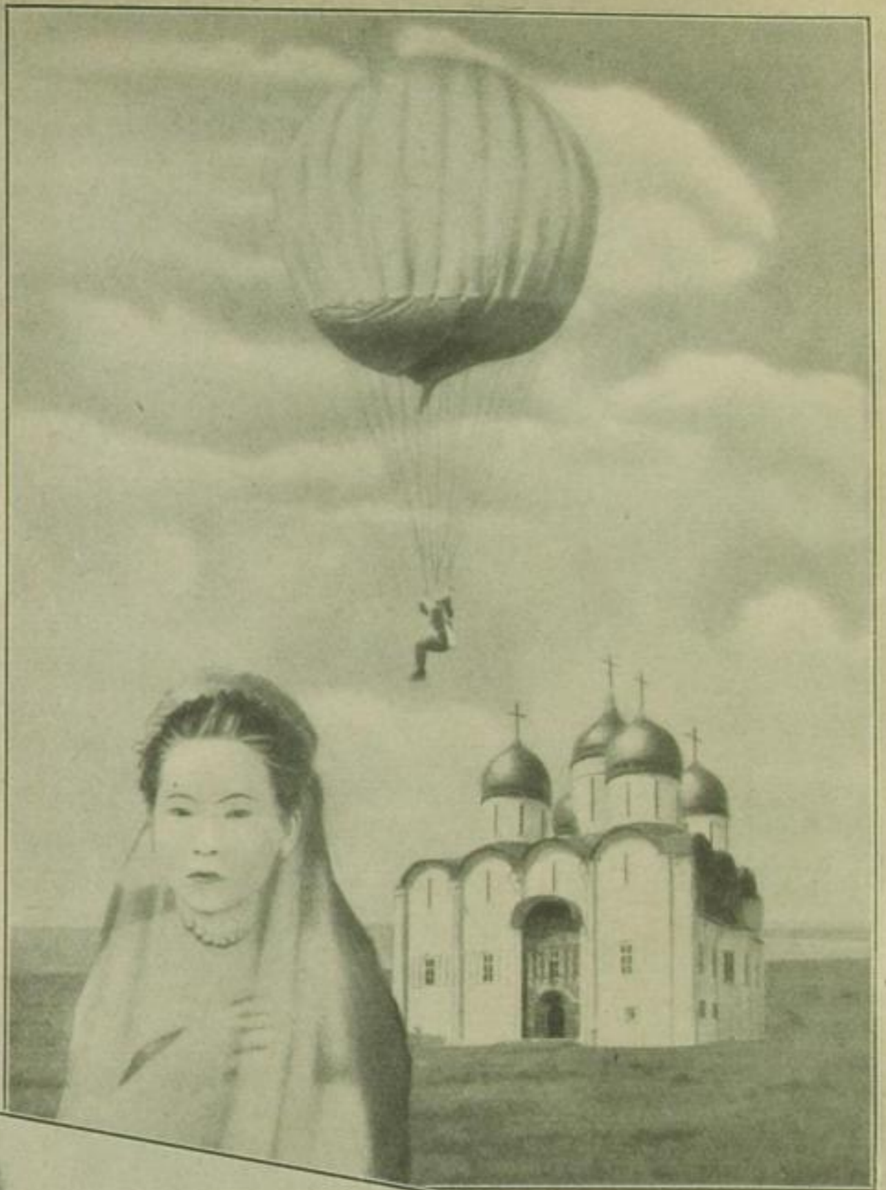
Die verlassene Braut

nach dem modernen Prinzip „es müssen Köpfe rollen!“ nicht verschont. Ein bißchen Filmromantik gefällig? Bitte, der Verführer lauert bereits auf die aus dem Fenster blickende Unschuld. Etwas Exotik? Die Flucht des Mannes vor der Frau mit allen Schikanen. Etwas zum Staunen? Ein eben entdecktes vorsintflutliches Untier. Etwas fürs Gemüt? Die traute Artistenfamilie. Am liebsten aber etwas, das wir alle nötig haben: ein klein wenig „corriger la fortune.“