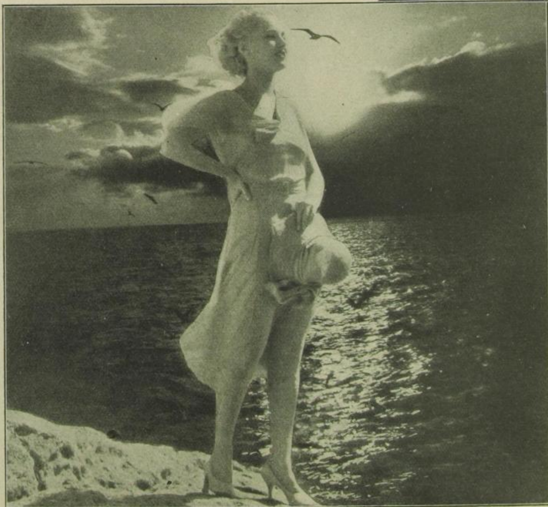
— aber auch ab und zu Sturmneigung